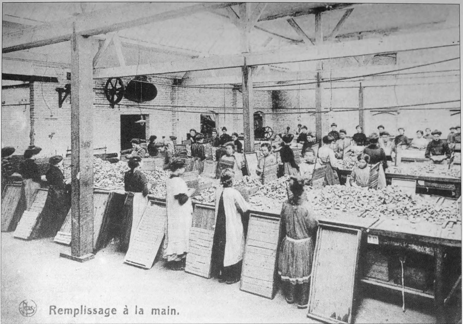
Arbeidsters aan het werk

De situatie in onze regio verschilde slechts in zover van het algemeen beeld van Vlaanderen dat de toestand er alleen nog slechter was. Van oudsher had de streek rond Geraardsbergen een zeer dichte bevolking, hoofdzakelijk wonende in kleine dorpen. Het kanton, bestaande uit de huidige deelgemeenten van Geraardsbergen met uitzondering van Ophasselt (kanton Herzeele) maar met inbegrip van Voorde (thans Ninove), bestond uit zestien kleine gemeenten met een gemiddelde oppervlakte van slechts 474 ha. Bovendien telde met uitzondering van Geraardsbergen en Overboelare alle overige gemeenten minder dan 2000 inwoners.