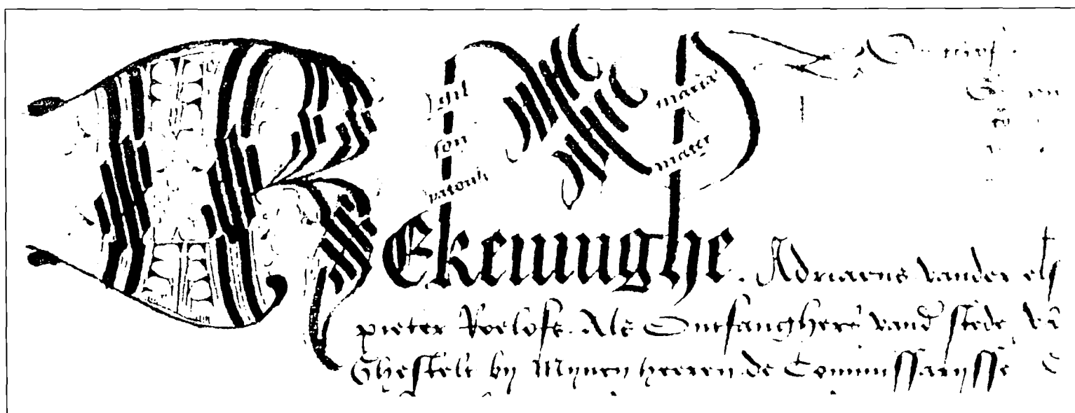
Initiaal R, een zoekplaatje voor zes narrenkoppen.

De zot: het werd een mode, inderdaad, als we zien dat ook de heren commissarissen voor de jaarlijkse vernieuwing van de wet (de magistraat) en het nazicht van de stadsrekeningen, bij hun bezoek aan de stad vergezeld waren van “hun” nar. “ Mais les commissaires, chargés de vérifier annuellement les comptes communaux, donnaient eux-mêmes l'exemple de ces étranges fantaisies en se faisant escorter de fous gagés par eux » zegt E. Van der Straeten. Ten andere, ook de magistraat wilde niet onderdoen en had één of meer zotten in betaalde dienst: « le fou de la localité...des fous gambadant autour des tireurs à l'arc... les bouffons... que le magistrat de Grammont avait à son service » (E. Van der Straeten, p.224-227). Het antwoord op de vraag: wie is die nar? is dus niet eenvoudig. Is het de stadsnar? De rederijkersnar? Of de nar van de commissarissen? Het zou wel eens kunnen dat de scribent, om de commissarissen goed te stemmen, hun nar afgebeeld heeft. In de periode dat steekpenningen, wijnpotterij, vleierij en corruptie aan de orde van de dag waren, moeten alle middelen goed geweest zijn als ze maar hun doel bereikten. Trouwens, vandaag zijn we er niet beter aan toe! “ t Is een grote wijsheid op een gepaste manier zot te zijn ” (Erasmus: