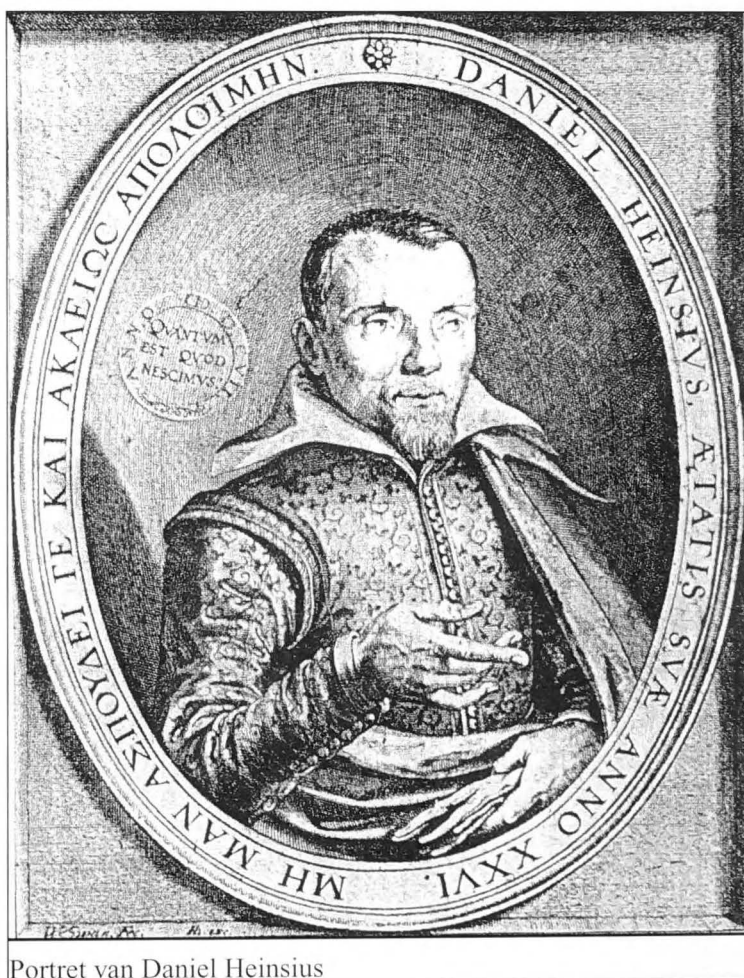
Portret van Daniel Heinsius

Jan Dousa, de stoere verdediger van Leiden tegen de Spaanse belegeraar, de eerste curator van de Leidse hogeschool, rekende de jonge Daniel Heins, als "vir inter literatos princeps" bestempeld door de vriendenkring, Marnix van St. Aldegonde, Petrus Forestus, Paulus Merula, Lipsius, Vossius, C. Huygens, P. Cunoëus, Scriverius, Hugo Grotius, tot zijn beste vrienden.