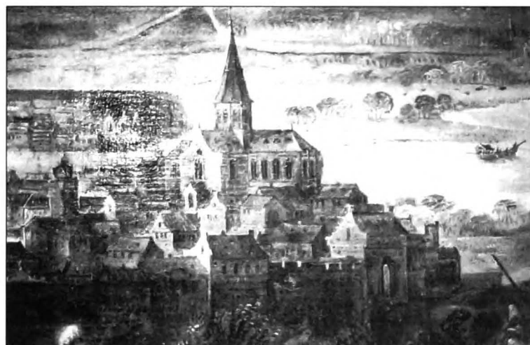
“Gezicht op Geraardsbergen”, schilderij van Joos de Momper de Jonge ca 1590. Detail met o.a. de Sint-Adriaansabdij.

Het convent verpachtte o.a. in Idegem: het goed te Bullegem (22 ha + slagmolen); in Moerbeke: het hof te Copenhole (31 ha); in Onkerzele: het hof ten Broeke in twee delen (samen 150 ha); in Schendelbeke: het hof te Schendelbeke (40 ha) en verder nog diverse gronden in Moerbeke, Nieuwenhove, Waarbeke, Schendelbeke, Onkerzele-Nederboelare, Smeerebbe, Overboelare-Goeferdinge en Zarlardinging. De abt baatte in eigen beheer 159 ha in Onkerzele-Nederboelare uit; hij verpachtte verder gronden in Onkerzele-Nederboelare, Schendelbeke en Overboelare.