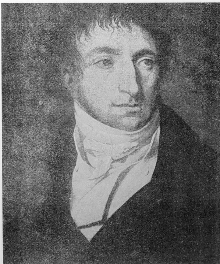
Edouard de Walckiers

Suzanne Tassier, Figures révolutionnaires, XVIIIe siècle . Coll. notre passé. La renaissance du livre. Brux. s.d.