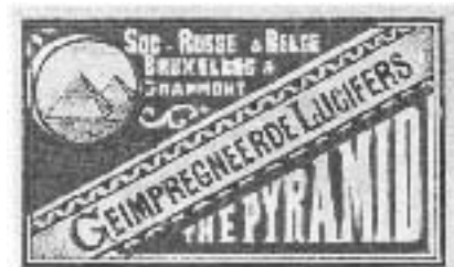
Afb. 4: Uit "150 jaar lucifersindustrie in Geraardsbergen" door D. Robben en R. Van Den Bossche.

fabrieksarbeiders protesteerden tegen de lage lonen, ongezonde arbeidsvoorwaarden, kinderarbeid, betaling in natura, machtswillekeur der patroons en dergelijke meer. In Geraardsbergen werden in 1886 alle cafés gesloten en rijkswacht en leger moesten de orde handhaven. Uit het verslag der zitting van 7 augustus stip ik een tussenkomst van G. Mertens-Spitaels aan: "Il n'y a pas de règlement à Grammont au sujet de l'admission des enfants dans les établissements industriels; on les accepte depuis l'age de 5 à 6 ans: ils y travaillent, dès lors, du matin au soir. Les parents le demandent, on pourrait même dire qu'ils l'exigent". Uit deze laatste zin moeten we opmaken dat ook Mertens geen scrupules had op dit gebied. Samen met Richard Clerebaut bezocht Aug. De Winne in 1901 de fabriek van Mertens, genoemd "The Belgian Match Company", en hij vond ze "prima uitgerust". Hij