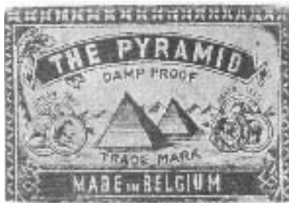
Afb. 3 "The Pyramid" het voornaamste handelsmerk van G. Mertens en Cie. Uit "150 jaar lucifersindustrie in Geraardsbergen" door D. Robben en R. Van Den Bossche

De Fabrique d'Allumettes Mertens-Van Wetter werd in 1878 de "Usine veuve G. Mertens-Van Wetter & enfants". In augustus 1886 zetelde een bij K.B. ingestelde Arbeidscommissie op het stadhuis te Geraardsbergen. In het voorjaar van 1886 waren in gans het land wilde stakingen uitgebroken waarmee de