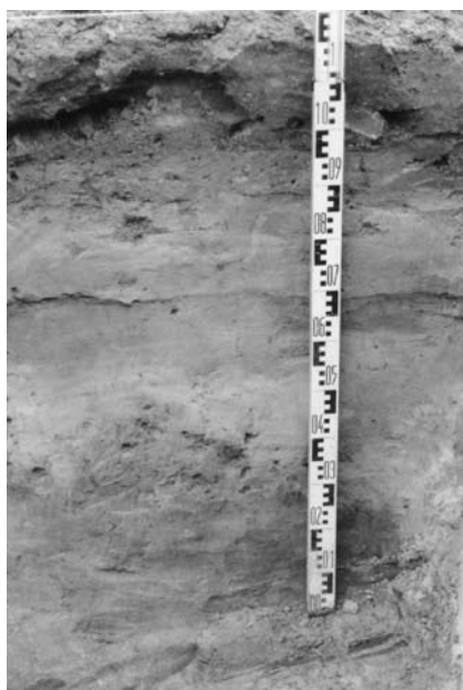
Afb.3: een volledig natuurlijke gelaagdheid in sleuf 1.

Het middeleeuwse loden waterleidingsnet dat onder meer de Marbol bevoorraadde van water evenals het oude, uit bakstenen gemetste, rioleringsnet (Afb.4) werd verscheidene malen aan-