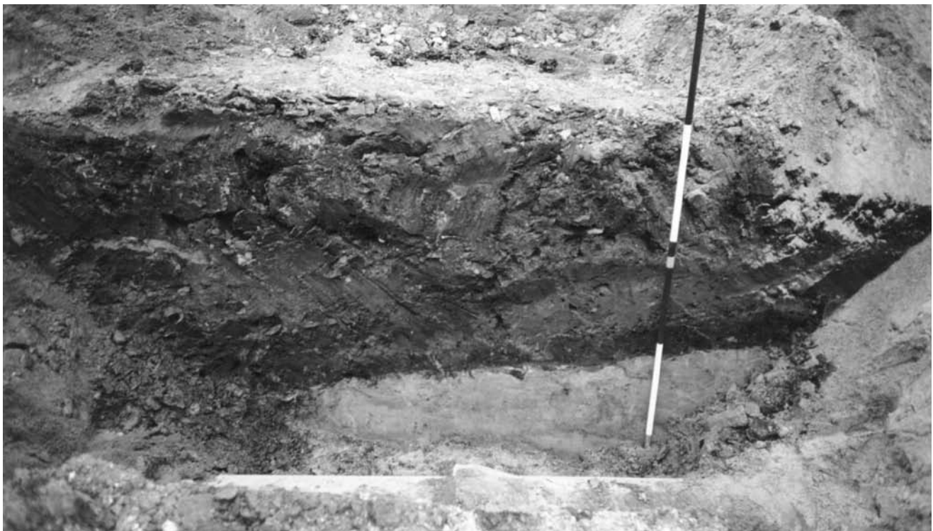
Afb.1: zuidprofiel van de sleuf voor de rioleringswerken ten noorden van de Sint-Bartholomeuskerk

Gezien deze resultaten in de hoger gelegen zone van de Markt, werd in samenspraak met het stadsbestuur,