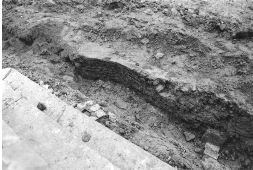
Afb.5: muurresten ten zuiden van de huidige fontein 'de Marbol'