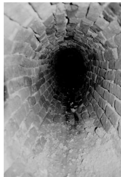
Afb.4: het oude in bakstenen gemetste rioleringsnet.