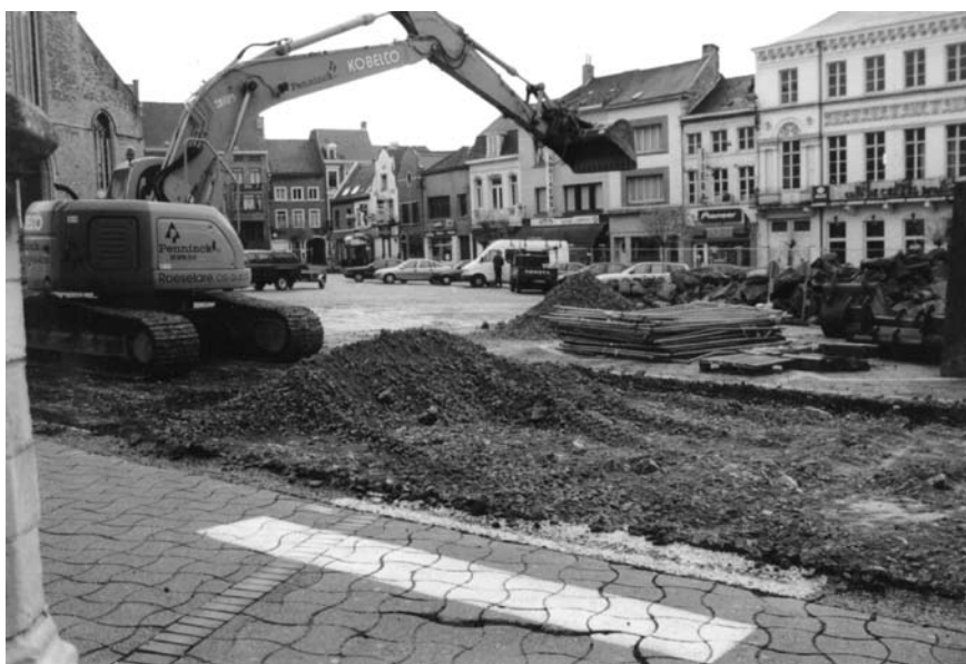
Afb.2: 24 november 2003: het asfalt, de marktbedekking en de funderingslaag worden machinaal weggegraven.

Op 24 november 2003 werd het asfalt, de marktbedekking en de funderingslaag machinaal weggegraven. (Afb.2) Om de hinder zoveel mogelijk te beperken werd besloten in een eerste fase slechts twee sleuven uit te zetten, sleuven 1 en 3. Al snel werd duidelijk dat in deze lager gelegen zone van de Markt de relatief ondiep gelegen middeleeuwse pakketten vroeger reeds grotendeels waren weggegraven.