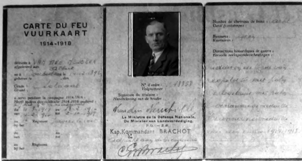
Afb.3: de vuurkaart

militair een vermelding had gekregen op het legerdagorder, wat hier dus was gebeurd.