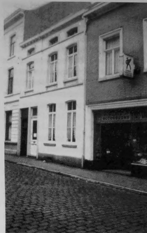
Het huis in de Adamstraat zoals het er uitzag in 1964. Het huis rechts is de voormalige muziekhandel Bruyland.