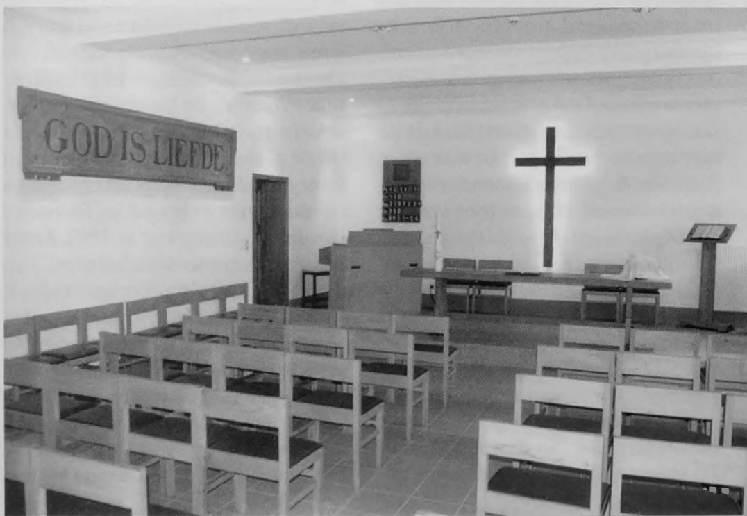
Interieur van de protestantse kerk in de Adamstraat

In deze beknopte bijdrage hebben we ons tot doel gesteld om een overzicht te geven van de geschiedenis van de protestantse gemeente in Geraardsbergen. Dat we dit deden met grove penseeltrek, heeft alles te maken met het feestelijke karakter van deze publicatie. Later hopen we, indien de mogelijkheid zich daartoe voordoet, ook enkele meer uitgewerkte biografische schetsen van Geraardsbergse predikanten aan de lezers van Gerardimontium te presenteren. Hoewel het leven van een protestantse gemeenschap strikt genomen niet beschreven kan worden - zoals we deden - vanuit de voorgangers alleen. Ze waren slechts schakels in een rij, dankzij wie de gemeenschap kon blijven functioneren. Tot op vandaag.