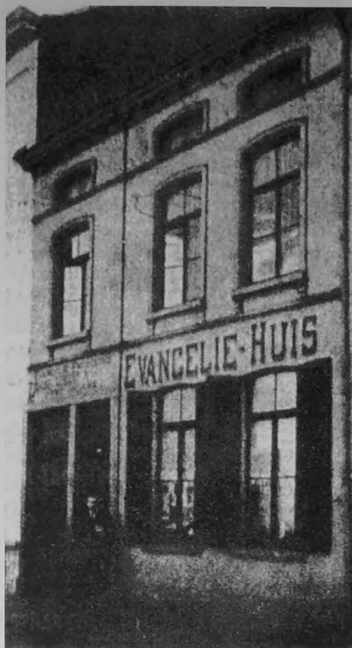
Oude foto van het 'Evangelie-huis' in de Adamstraat.