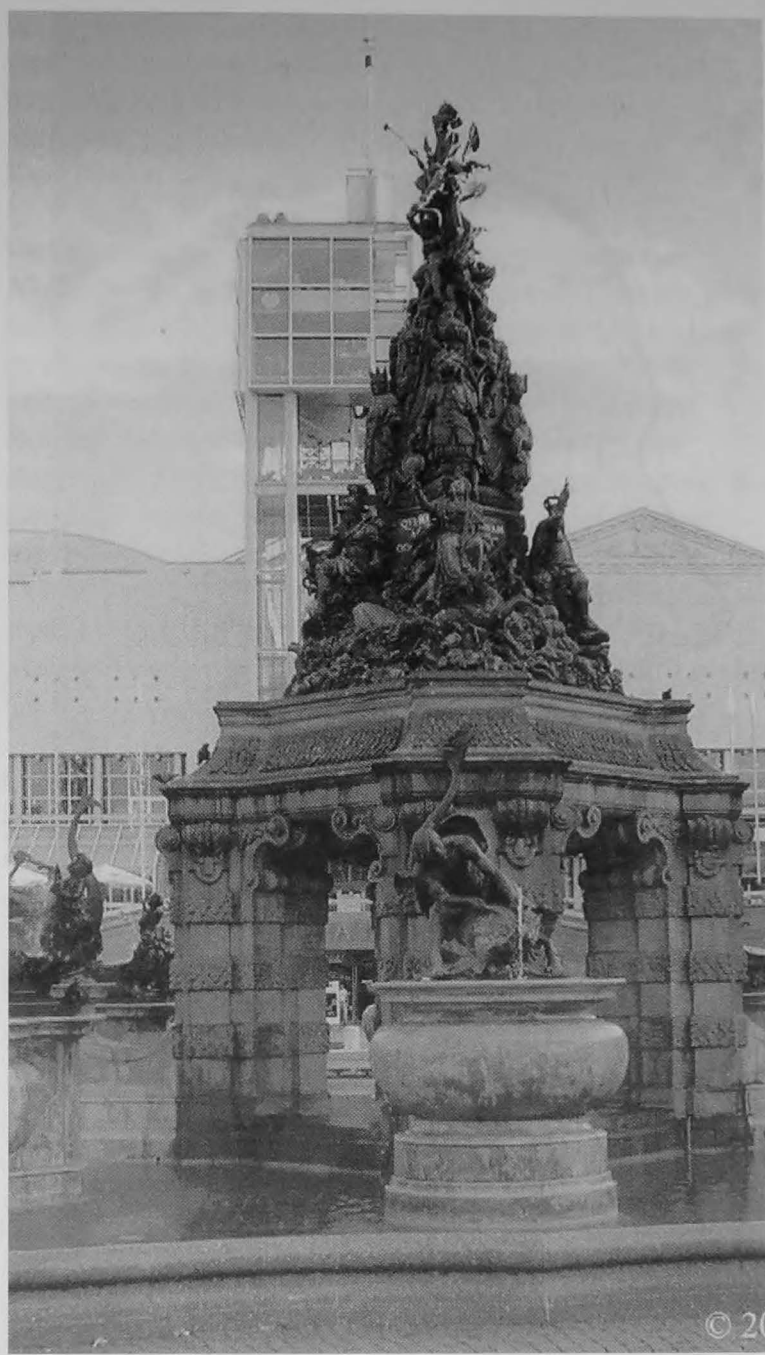
Recente foto van de statua

Gabriel Grupello vertegenwoordigde de laatbarok en werd vergeleken met zijn tijdgenoot Bernini.