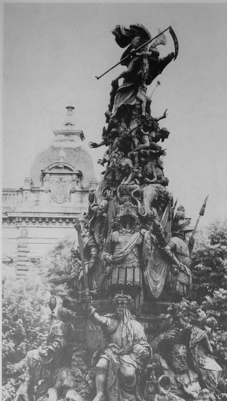
De statua vóór de restauratie