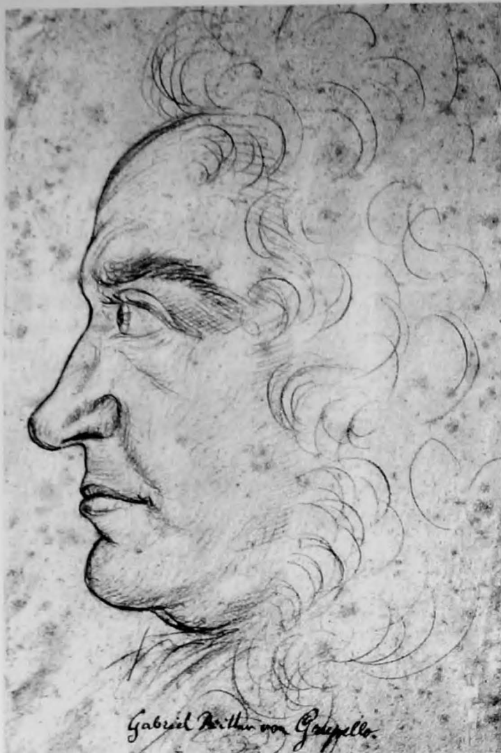
Zelfportret van Grupello

echtgenote Anna Maria di Medici. Hij voelt er zich onmiddellijk thuis en er gaat dan ook een grote scheppingsdrang van hem uit.