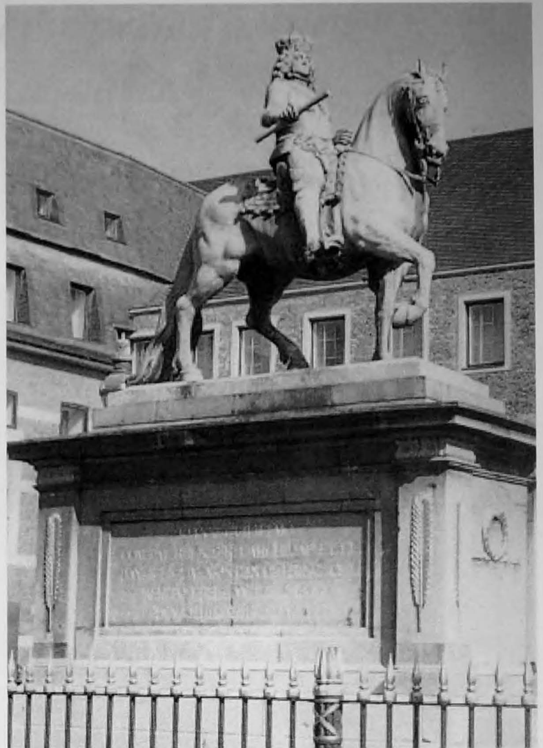
Ruitersstandbeeld van de keurvorst van Düsseldorf

In de periode 1709-1716 geeft de keurvorst de opdracht voor de zogenaamde Statua, een monumentale piramide van 12 meter hoog, bestemd als fontein voor de tuinen van de residentie van de keurvorst. Deze allegorie moest de deugden van de vorsten uitstralen. De Statua bestaat uit 3 grote op elkaar passende delen met op de hoeken 4 levensgrote beelden: Fortunia, Prudentia, Temperantia, en Justitia, en daartussen allegorische figuren. Deze allegorische figuren bestaan uit dieren en riviergoden: de Rijn, de Moezel en de Donau die zich in een barokke massa naar boven bewegen. Aan de oostzijde vecht Hercules tegen