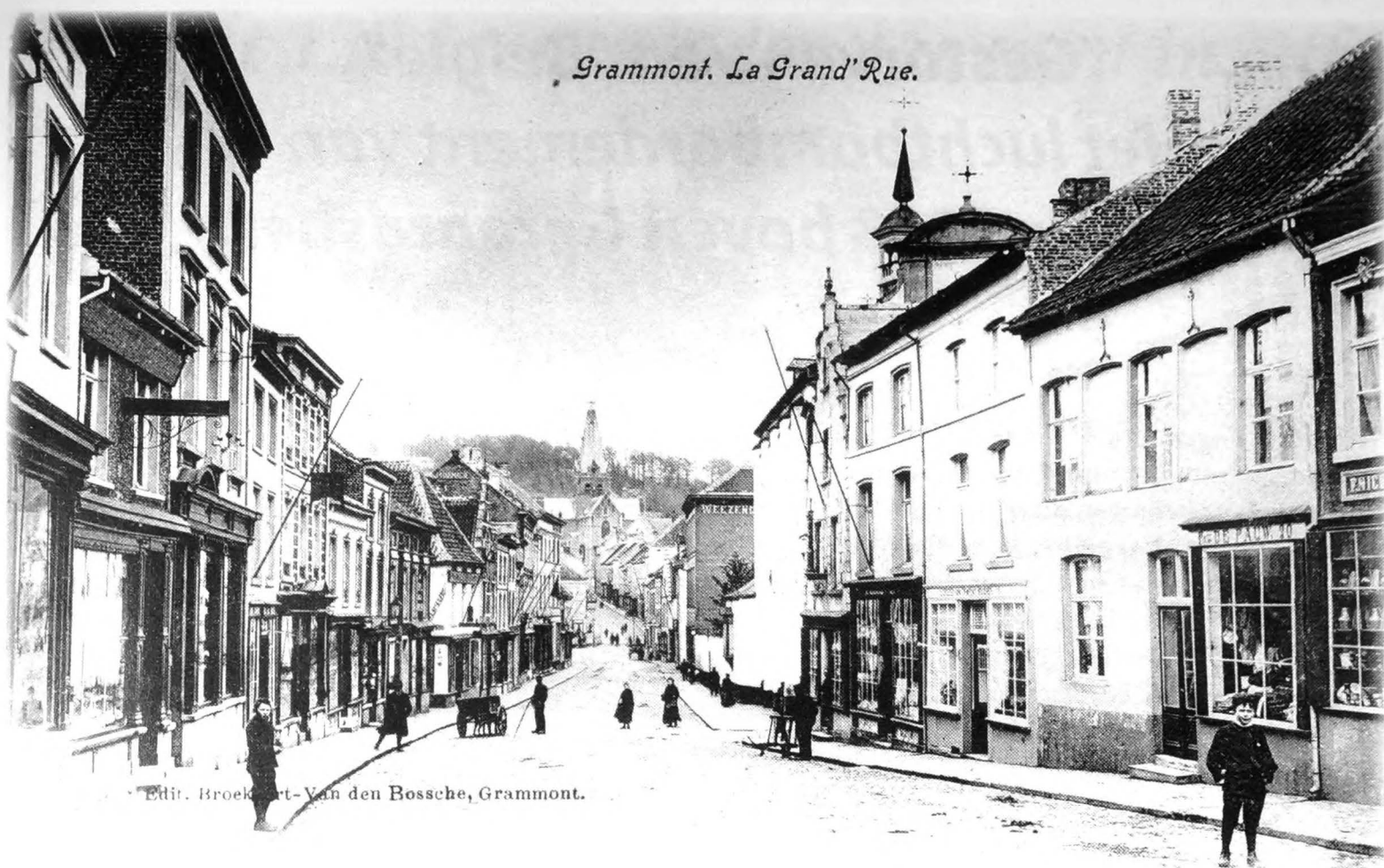
De Duitse bommen die neervallen in de Grotestraat eisen 14 dodelijke slachtoffers. De precieze locaties noch de aangebrachte materiële schade zijn bekend.