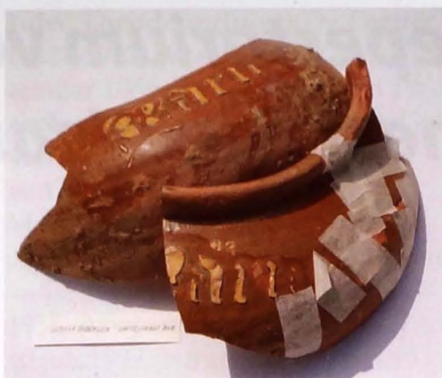
Fragmenten van een geglazuurde voorraadpot waarop in wit slib de naam "Maria" is aangebracht (af. 3).

De recent onderzochte sector situeerde zich in de late middeleeuwen binnen de ommuurde benedenstad. Uit de oude iconografie blijkt het areaal tussen de toenmalige Hoekstraat (bovenloop van huidige Grotestraat) en de Sint-Katelijnekerk (de huidige Sint-Catharinakerk) gekenmerkt door een vrij open karakter (afb. 4). Dit beeld wordt bevestigd door een eerste evaluatie van de archeologisch data: de onderzochte site bracht geen directe bewoningssporen of aanverwante resten voort. Hoewel het terrein vanaf de 13 de eeuw binnen de stadsvestingen kwam te liggen, fungeerde het eeuwenlang binnen het kader van agrarische activiteiten (akker- en/of tuinbouw, boomgaard,...); deze