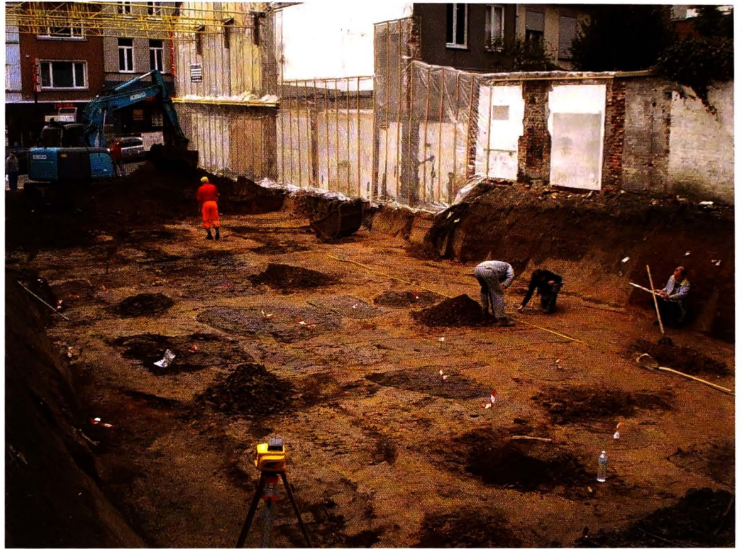
Archeologen van het PAM-Velzeke voeren een kleinschalig noodonderzoek uit in de Grotestraat te Geraardsbergen (afb. 1).

In de noordoostelijke hoek van het bouwterrein bevond zich het oudste spoor: in een houtskoolrijke opvullingslaag van deze kuil stak een rand van een kogelpot (een middeleeuws bolvormige pot) die typologisch en technisch in de 10 de - 11 de eeuw onder te brengen valt. Over het volledige oppervlak van de bouwput strekte zich verder een 60 tot 80 cm dik, lichtgrijs pakket uit, ontstaan als gevolg van agrarische activiteiten. Enkele kuilen van diverse afmetingen hingen samen met deze laag: ze bevatten overwegend grijze ceramiek (fragmenten van onder meer kogelpotten en kruiken) en enkele scherfjes hoog versierd aardewerk. Een algemene datering in de tweede helft van de 13 de en eerste helft van de 14 de eeuw lijkt voor dit niveau aangewezen.