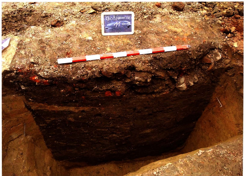
Een met afvallagen opgevulde leemwinningsput uit de 15de of 16de eeuw (afb. 2).