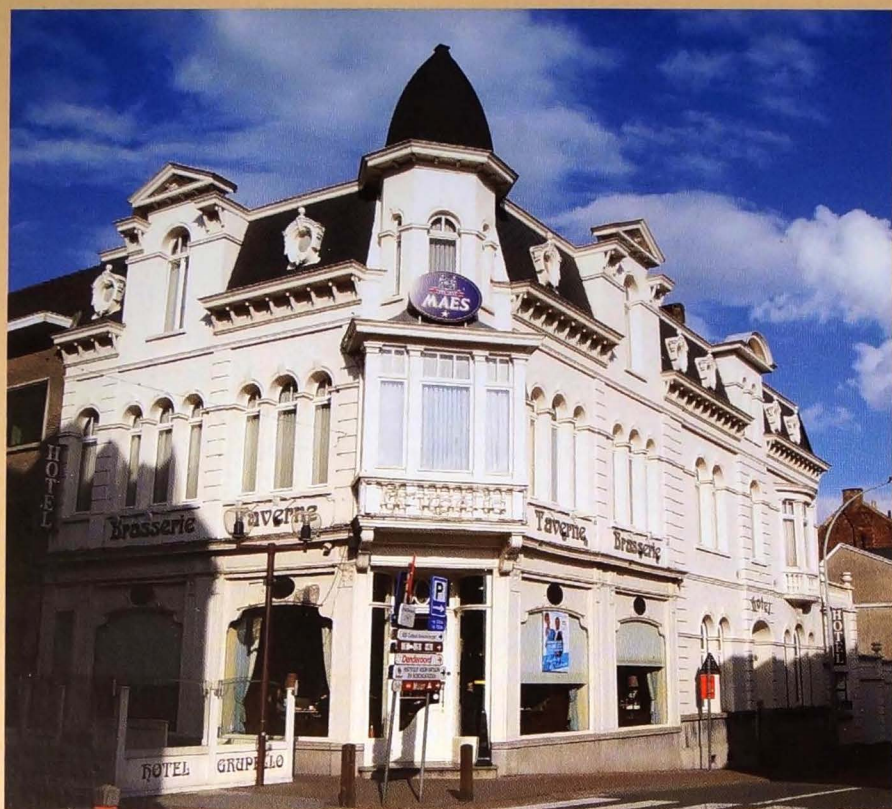
Hotel Brasserie "Grupello" op de hoek van de Lessensestraat met de Verhaegenlaan