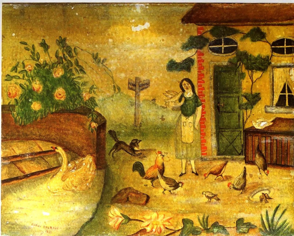
Olieschilderijtje op hout met landelijk tafereel door Oscar Delbauf in 1877 (Verzameling Jacqueline Delbauve)

een hele evolutie doorgemaakt. Het is dan ook de taak van de meesterkleermaker in te spelen op de diverse modetrends. Tijdens de eerste helft van de 19 de eeuw bezorgt de industriële revolutie de burger zijn machtspositie. De man heeft thuis de meeste rechten en hij laat dit zien door zijn kledij: donker, degelijk, onkreukbaar en met een hoge witte boord. Na 1850