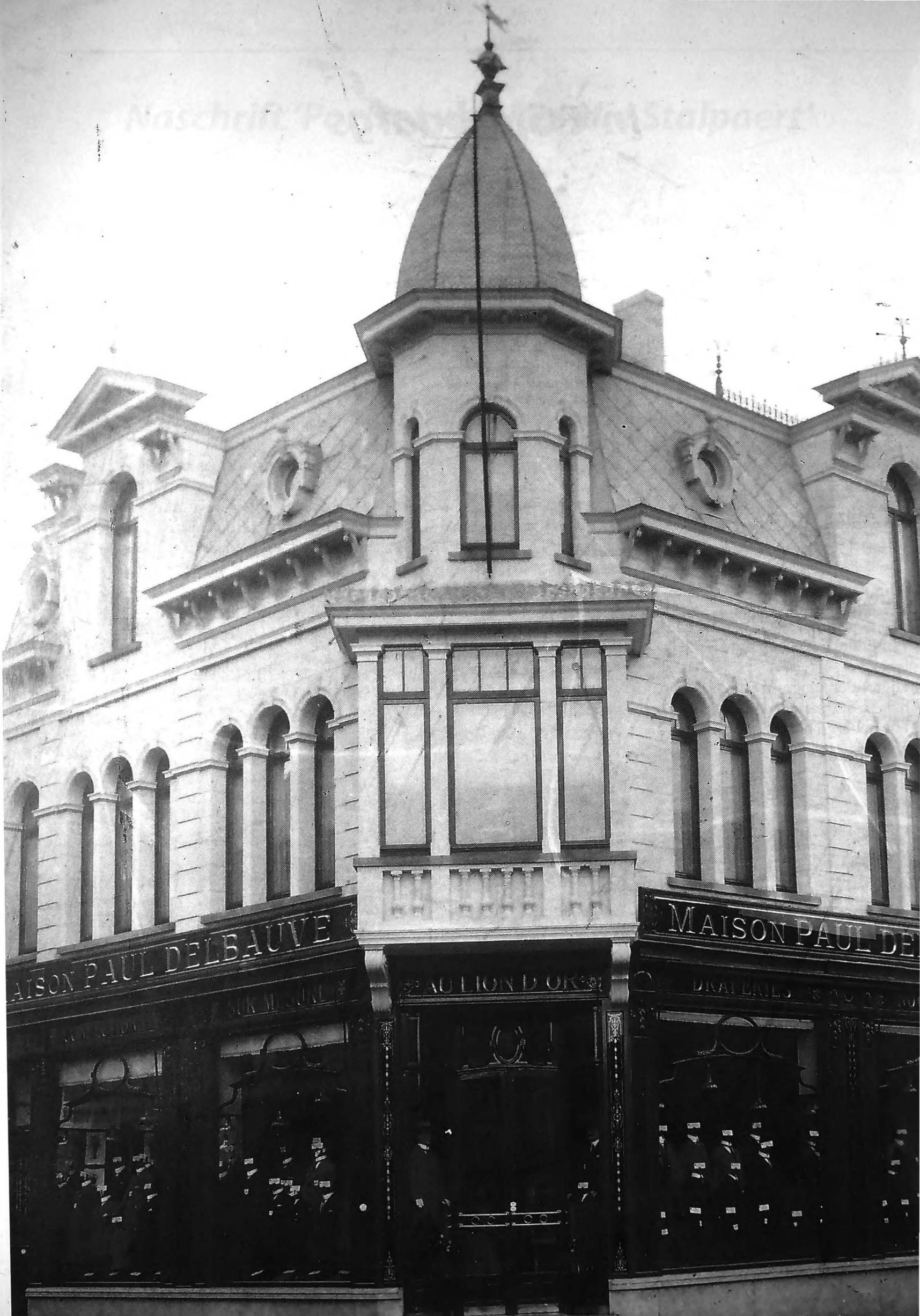
Zicht op de kledingzaak Paul Delbaue door fotograaf Richard De Lil tijdens het interbellum (Verzameling Jean-Pierre Delbaue)