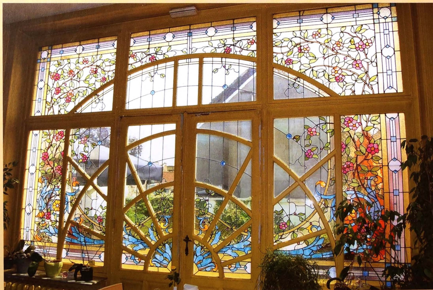
Art deco motieven zijn terug te vinden in het houtwerk en het brandglas van deuren en vensters.