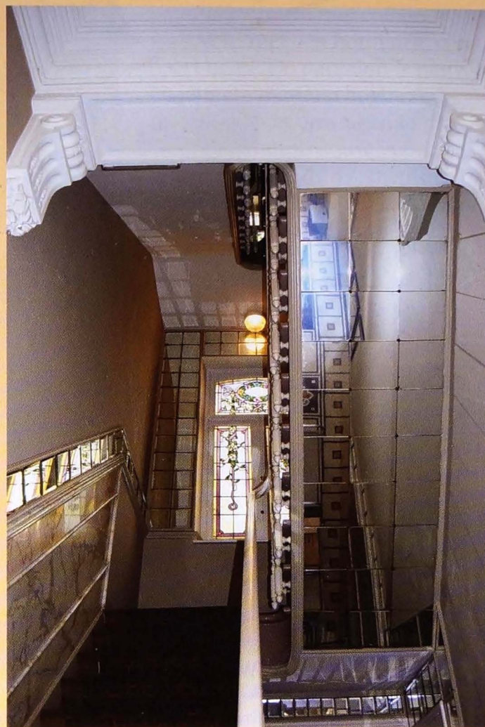
De muren van de trappenhal en de wand onder de trap zijn bekleed met wandtegels uit spiegelglas