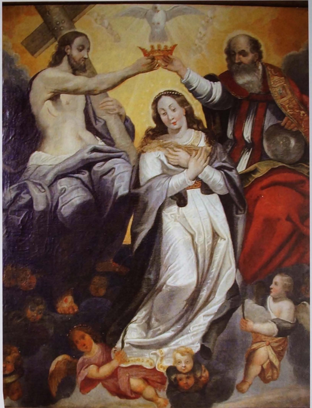
"De Bekroning van Maria" (Doek, 1,38 x 1,08 m.). Vermoedelijk daterend uit de eerste helft van de 17 e eeuw. Onze-Lieve-Vrouw Hemelvaartkerk, Moerbeke.

Op grond van al wat hier is uiteengezet, kan met zekerheid worden gesteld dat het doek De Bekroning van Maria niet het werk is van Hans Trossure.