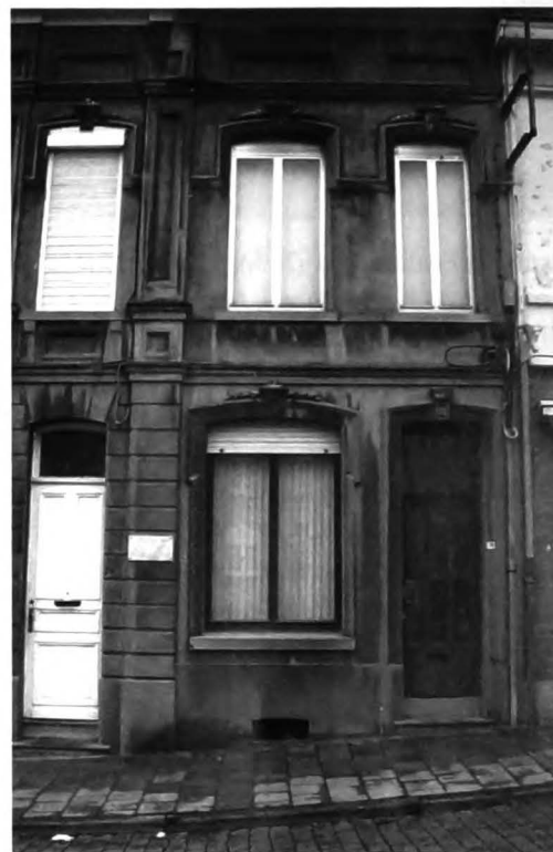
Isabelle Fischlowitz woonde op de Vesten nr. 76 tot ze op 11 mei 1944 werd weggevoerd door de Gestapo.

de wagens terug en reden langs de linkerzijde de straat af toen ze plots stopten voor het huis van juffrouw Fischlowitz. Ze stapten meteen het huis binnen. De juffrouw die op dat moment pianoles aan het geven was, moest onmiddellijk stoppen, werd door de Duitsers naar buiten gebracht met als enige bagage een broodje. Ze werd op de vrachtwagen geduwd met bestemming de Dossinkazerne te Mechelen, waar ze dan op 31 juli 1944 op transport werd gezet naar de uitroeiingskampen in Polen".