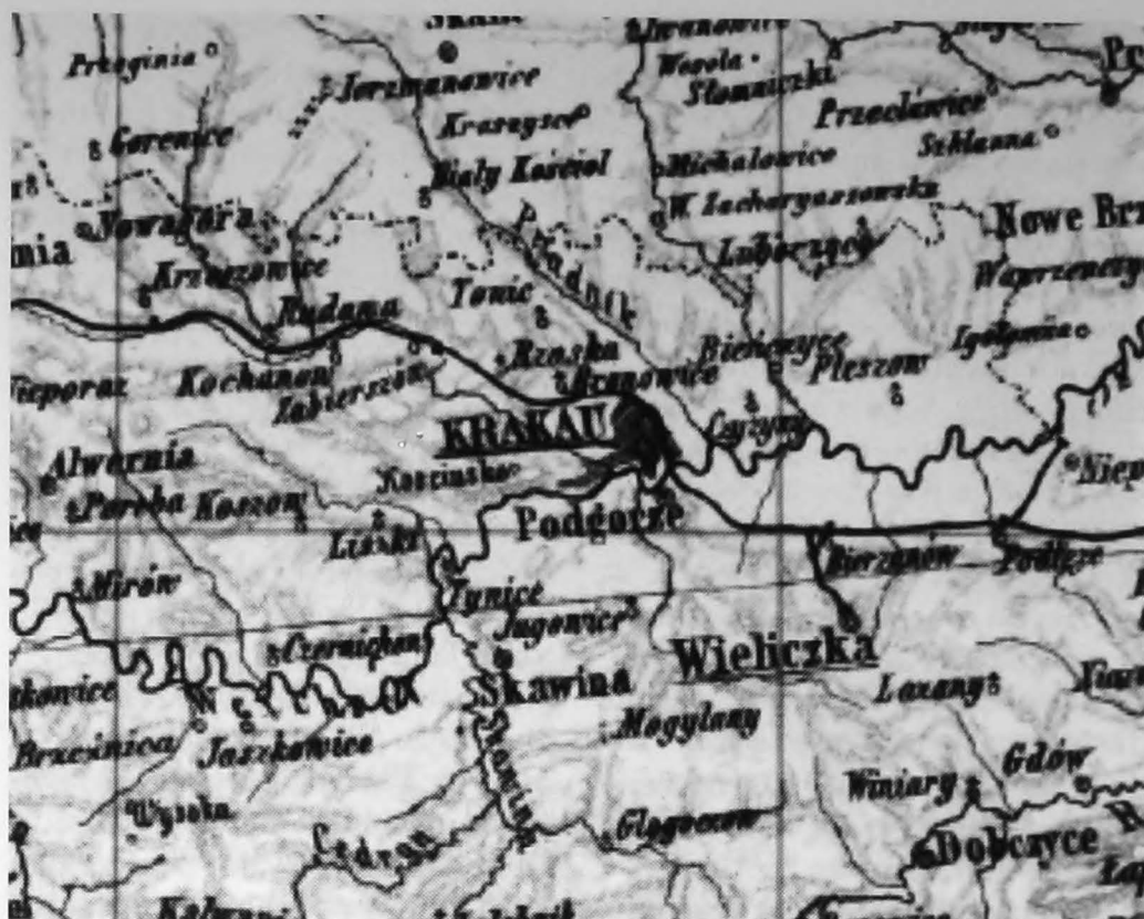
Krakau en de grens tussen de Oostenrijkse provincie Galicië en Russisch Polen op het einde van de jaren 1880. Krakau ligt aan de Vistula- of Weichselrivier die noordwaarts naar Warchau en Dantzig vloeit om uit te monden in de Baltische zee.

Polen heeft het steeds moeilijk gehad om zijn onafhankelijkheid te vrijwaren. Tussen 1772 en 1800 kerfden Catharina de Grote van Rusland, de Oostenrijkers en de Pruisen (Duitsland) steeds maar