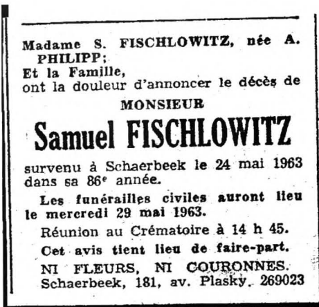
Overlijdensberichtje in een Brusselse krant (Le Soir ?)

Jonge Wacht (51) . Op een gegeven ogenblik is hij naar Brussel gaan wonen. Hij heeft de oorlog overleefd en overleed in Schaarbeek (Brussel) op 24 mei 1963.