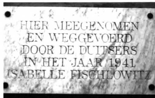
Aan de gevel van het huis waar ze woonde is een gedenkplaat aangebracht