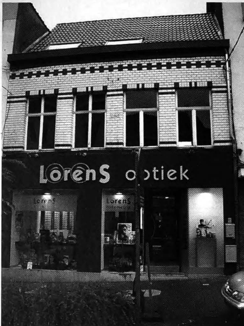
Het huis Grotestraat nr. 40 anno 208, waar de Fischlowitzten woonden in 1903. De gevel van de bovenverdieping is bewaard gebleven..

Op 17 juli 1945 koopt Raphaël het pand nr. 35 op het Stationsplein waar hij in 1947 intrekt en blijft wonen tot zijn overlijden op 6 juni