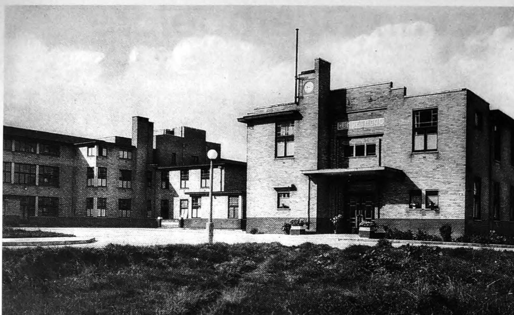
Sanatorium (Algemeen zicht - 1956) In 1931 richten negentien gemeenten en de COO Geraardsbergen de 'Samenwerkende Maatschappij Tusschengemeentelijk Hospitaal-Sanatorium van Geeraardsbergen' op met de bedoeling 'het verzorgen van behoeftigen, chronische invalidedeteringlijders en deze aangedaan van besmettelijke ziekten'. In 1938 start op de Kleine Buizemont de bouw van het sanatorium. De plannen zijn getekend door de Gentse architect Maurits Aubert. Ze zijn een voorbeeld van een eerder spaarzaam kubisme. Het hospitaal wordt in 1952 in gebruik genomen. De uitbating als sanatorium stopt in 1978. De instelling is intussen omgevormd tot een bejaardenhuis. Acht jaar later neemt het OCMW Geraardsbergen het rustoord over.

promoveert in Leuven op 11 juli 1968 (visum: 27 december 1968). Hij is enkele jaren arts in het sanatorium Denderoord, Hoge Buizemont 243. In 1972 verhuist hij naar Zeist (Nederland). Hij krijgt er in 1975 de Nederlandse nationaliteit door naturalisatie.