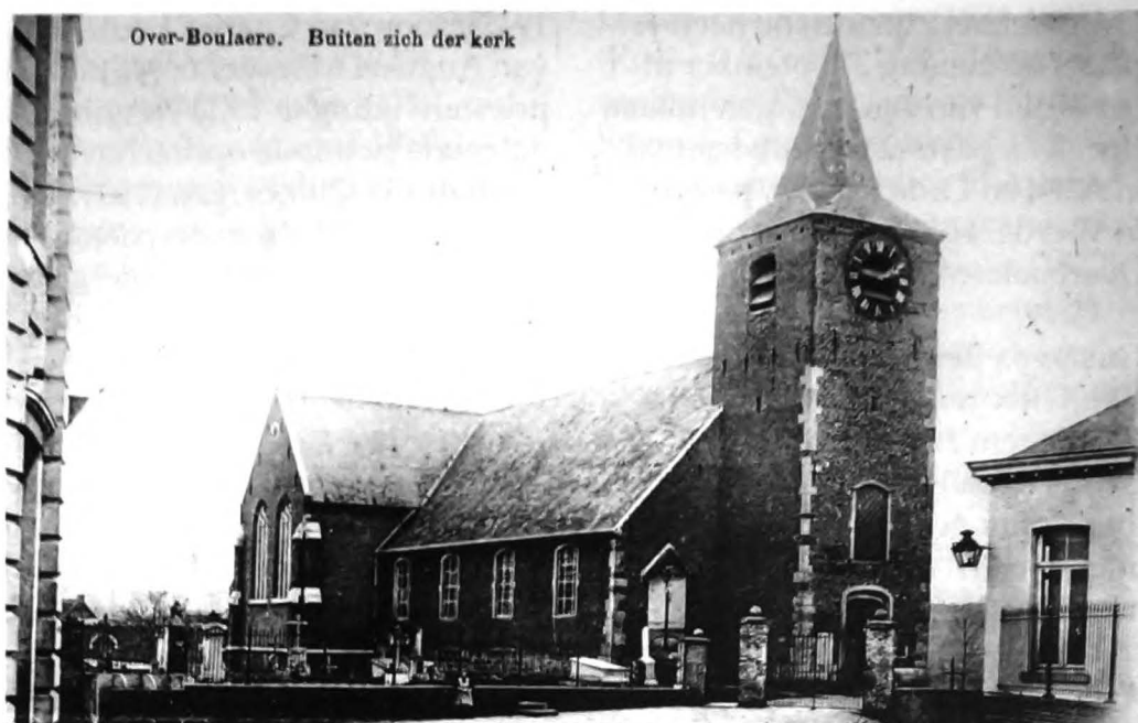
De kerk (1920) De Sint-Aldegondiskerk wordt voor het eerst vermeld in 1070 als ze aan de abdij van het Heilig Graf van Kamerijk wordt geschonken. Het huidige gebouw dateert grotendeels van 1777, maar is in 1907 gerestaureerd en uitgebreid met een neogotisch transept, koor en sacristieën.