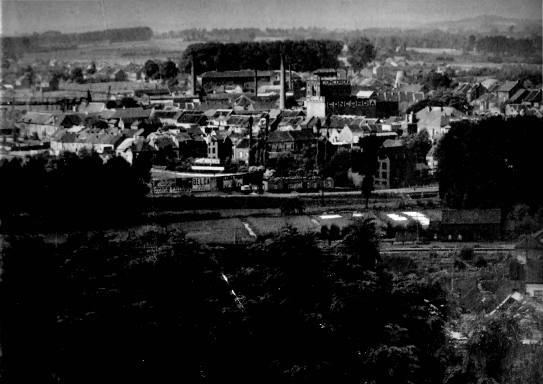
Panoramisch zicht op de Luna-velodroom met de opvallende reclame van de sigarettenmerken Belga en St. Michel. In de achtergrond zien we de brouwerij Concordia, de oude allumettenfabriek van Delaunoit, eigendom van de n.v. Union Allumettière (1929-1970) (63), de zwart-beenfabriek op Overboelare... (Detail)