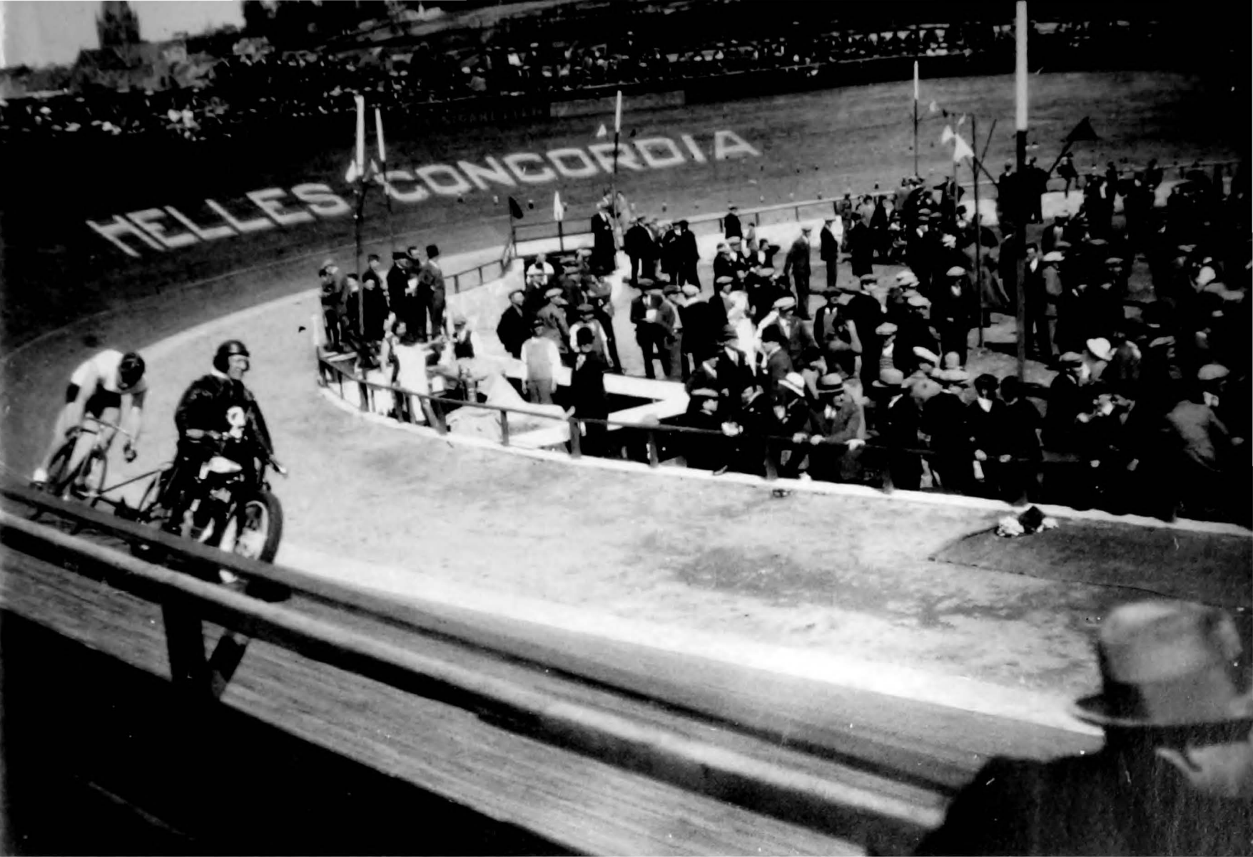
Koersen achter motoren. Het middenveld, de zogenaamde 'pelouse', is nog niet verhard.