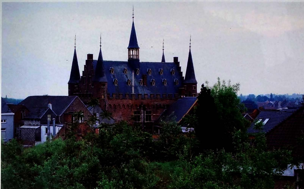
Met de afbraak van alle gebouwen achter het Volkshuis krijgt men vanaf de woningen van de Vesten een prachtig zicht op de meest authentieke achterzijde van het stadhuis

zijn twee smalle doorgangen: naast het voormalig Sint-Jorishof (10) en hogerop achter het eerder vermelde korfboogdeurtje. In het laatste geval gaat het volgens de Inventaris van het Bouwkundig Erfgoed (1978) om een afgesloten brandgang. Zoals hoger vermeld, meent Francq meent hier het begin van het tracé van het middeleeuwse Ingelandstraatje te herkennen.