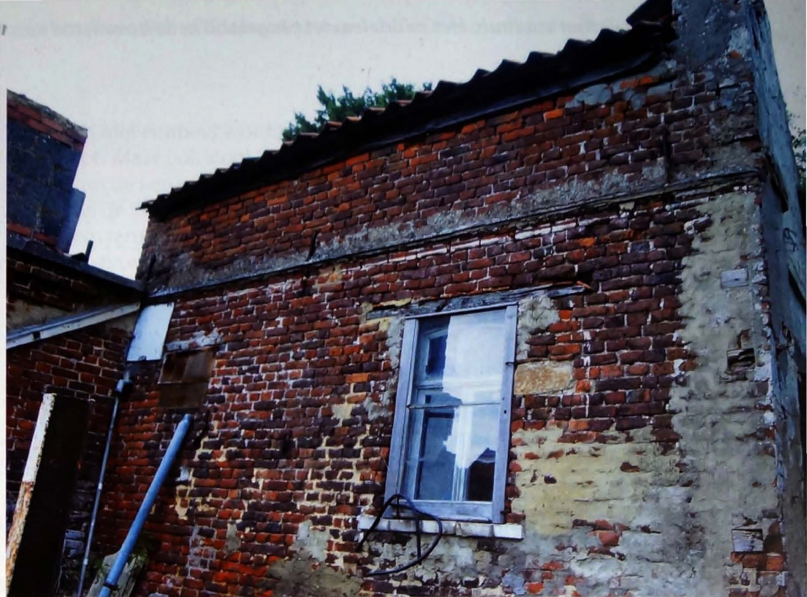
Links: vooraanzicht van het huisje met bepleisterde gevel, langs beide zijden geflankeerd door opgaand metselwerk. Rechts: op de zijgevels van het huisje, opgetrokken uit baksteen en hersteld met recuperatiemateriaal, zijn heel wat bouwsporen te vinden.