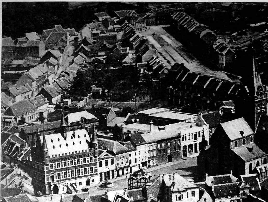
Op deze luchtfoto uit het interbellum zien we hoe een groot deel van het binnenblok is ingenomen door het gebouwencomplex van het Volkshuis.

start met de bouw van een nieuwe feestzaal, die vanaf 1909 ook als cinemazaal gaat fungeren. Volgens L. Waelraet zou onder het podium een oude vluchtgang vertrekken die een bocht maakt onder de tuintjes van de woningen van de Vesten om te eindigen in het bos achter de stadsmuren. In 1991 zou de gang op diverse plaatsen zijn ingestort. Verder bevinden zich achter de feestzaal nog een oud slachthuis, paardenstallen, een bureel, magazijnen, garages, een bakkerij en het machinehuis om elektriciteit te produceren. Een belangrijk deel van het binnenblok, waar voorheen Fort Van Landuyt stond, blijft onbebouwd, maar is nu helemaal ingesloten door de nieuwe huizenrij op de Vesten. Hier worden kippen gekweekt; er is een groentetuin, een boomgaard en een bleekweide. In 1923 en de volgende jaren wordt langs de Markt een nieuw Volkshuis opgericht. Dit gebouw zal gedurende de voorbije eeuw generaties socialisten lokken voor vermaak en