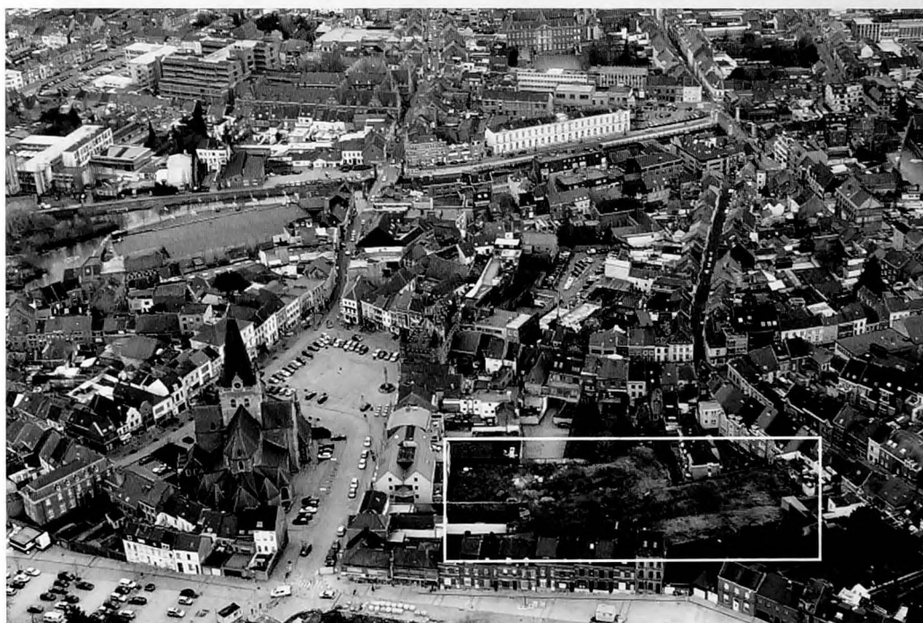
Gezien vanuit de lucht vertegenwoordigt het binnenblok Markt-Vesten-Vredestraat-Steenstraat (hier omkaderd) een belangrijke strook groene open ruimte in de bovenstad. (Foto G. Welleman, voorjaar 2009)

Verscheidene oude teksten uit de 14 de en 15 de eeuw liegen er niet om. In een oorkonde van het Onze-Lieve-Vrouwhospitaal uit 1386 staat vermeld: “(...) dat geleghen es ande maerckt tusschen piet(er) crap-proens erue was in deen side ende den straetkine dat men heet jn jnghelant an dande(re) side”. De stadsrekening van 1398 spreekt over een bron op deze locatie: “(...) an eenen borre in jnghelant die ter merchtborre dient”. En wat verder in de tekst, wordt verduidelijkt dat hier een aarden weg loopt: “(...) van der erden wech te voerene die acht(er) toleeshuus lag en(de) in jnghellant”. Tijdens de 15 de eeuw wordt het bestaan van het straatje meermaals bevestigd. In een regest van het archief van de Sint-Adriaansabdij uit 1406 wordt het “jnghellant straetkin” vermeld. In datzelfde archief wordt in 1423 gesproken van een zekere Jacops van inghelant . Documenten van het hoger vermelde Onze-Lieve-Vrouwhospitaal spreken in datzelfde jaar eveneens over dit straatje. Nog nauwkeurige beschrijvingen vinden we in beide vermelde archieven tijdens het laatste kwart van de 15 de eeuw. Zo staat in een renteboek van de abdij uit 1483 “(...) ghelegghen jeghen de cappelle up den houc va(n)