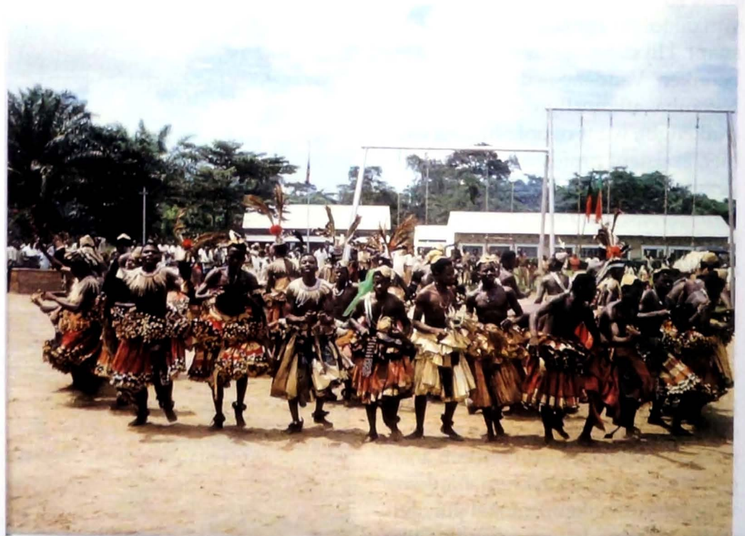
Bakuba-leerlingen in traditionele dans

vooral hun vrouwen (!) aan de drank zouden gaan want dan kon men zich aan het ergste verwachten. Het toeval wou dat een van de paters een vrijgeleide had met daarop tal van stempels van de hogere legerleiding. Dit was hun redding en alles wat ze afgenomen was werd teruggegeven. Ze konden hun reis verder zetten. Terug op weg, werden ze weer gearresteerd, door de politie ditmaal die ze voor de nieuwe (Kongolese) commissaris in Luebo bracht. Gelukkig waren ze niet vreemd voor die man. Hij raadde verder doorreizen die dag af. Dus bleven ze in Luebo waar ze logies kregen op de missie van de scheutisten. De volgende dag naar Mweka. Daar vernamen ze wat de bisschop en nog vier confraters was overkomen. Na te zijn aangehouden door soldaten, moesten ze eerst op de grond liggen, plat op de buik; dan hun toga uittrekken en blootvoets en in looppas naar het gevangenisgebouw draven, begeleid door politiemannen per fiets. De overige blanken uit Mweka ondergingen hetzelfde lot. Terug vrij en onderweg naar Bulongo werd het gezelschap wederrechtelijk lastig gevallen door politiemensen. De politiecom-