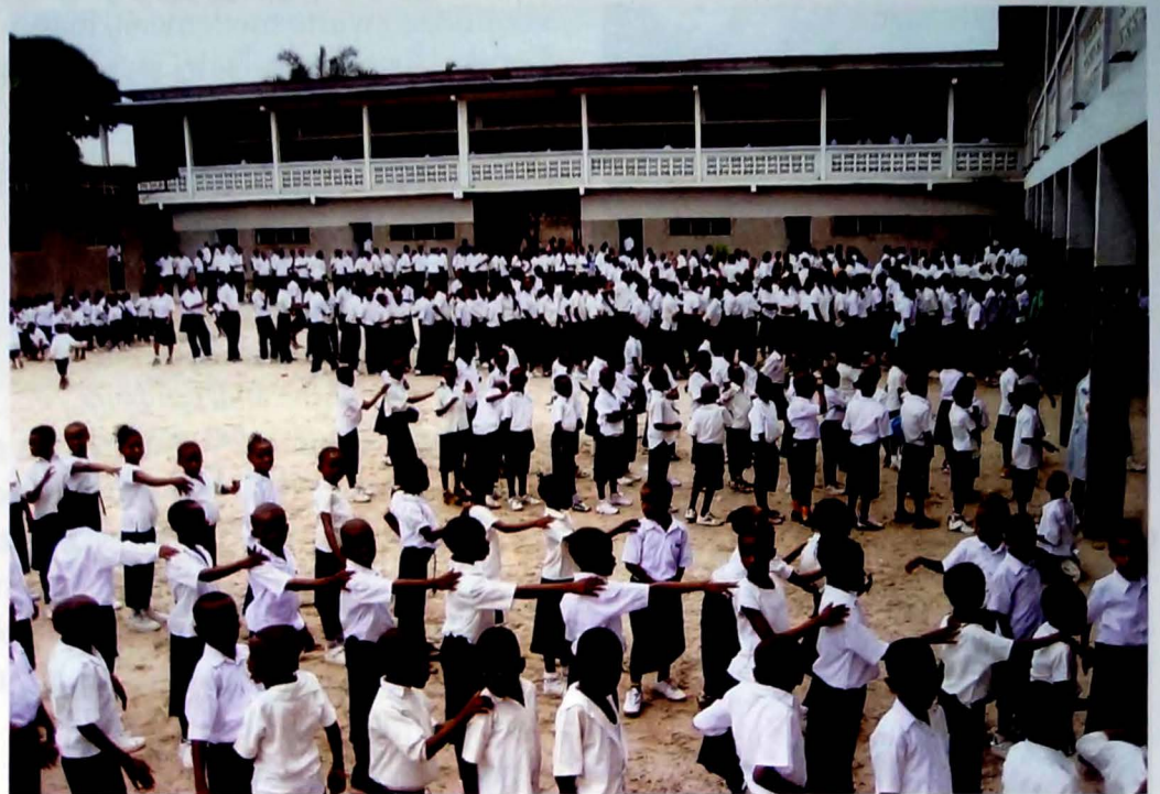
Detailfoto "Collège Saint-Etienne" in Limete (Kinshasa)

Op het college was de spanning te snijden. De school was staatseigendom geworden met al wat ooit voor het onderwijs had gediend. De enige leerling van het laatste jaar, kopman van de J.M.P.R., had tot taak het doen en laten van de paters van nabij te volgen en hij moest er onder meer over waken dat toch niets vanuit de school naar de missie zou verhuizen. Dit nam niet weg dat een van de nieuwe citoyens , een voor-aanstaande politieke figuur nota bene, zonder scrupules zijn oude schrijfmachine wou omruilen met