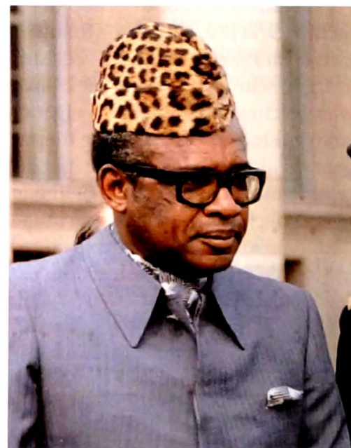
Joseph Désiré Mobutu

het land was hersteld. Joseph Désiré Mobutu die zichzelf tot luitenant-generaal had bevorderd, had alle stammentwisten en de aanhang van Lumumba weten te onderdrukken.