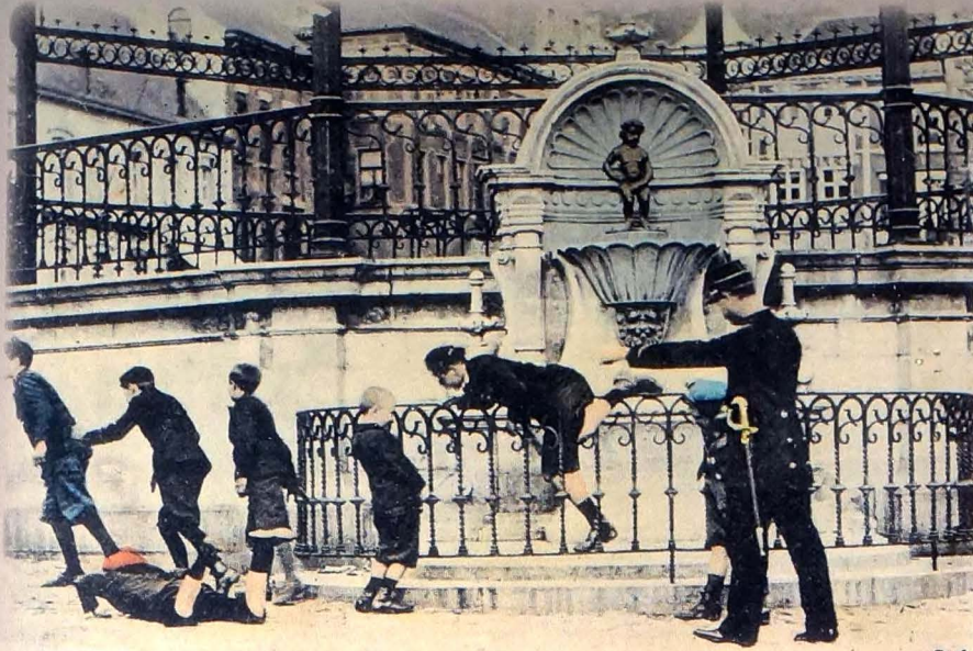
Grammont. Le manneken Piss.

my friend would like to see the fountain