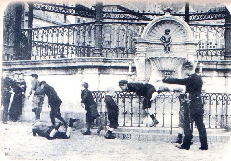
Grammont. — Le Manneken-Pis.