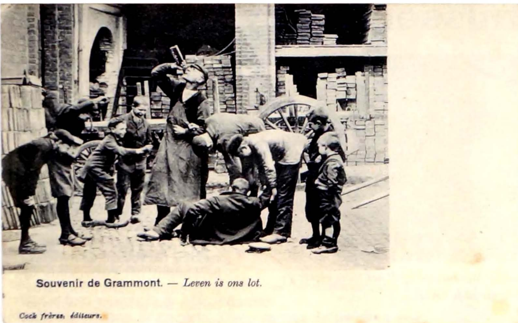
Souvenir de Grammont. — Leven is ons lot.