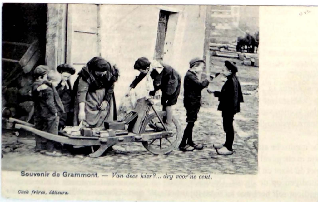
Souvenir de Grammont. — Van dees hier?... dry voor ne cent.

Een mooi geënceneerd tafereel aan de magazijnen Flamée.