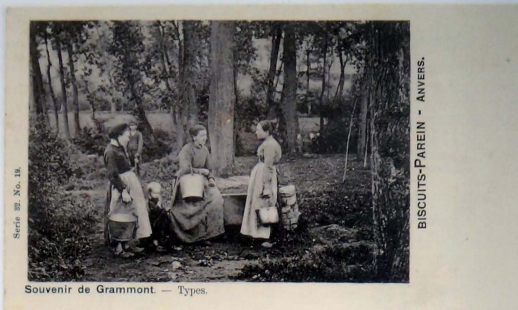
Prentkaart uit 1900, uitgegeven door Vanderauwera & Cie, Bruxelles, met een van de drie gekende opnames rond dit thema. (Verzameling Ph. Haegeman)

Het is weinig waarschijnlijk dat Cock dit thema naar voorbeeld van Declercq zou geënceneerd hebben. Vermoedelijk gaat het hier ook om een cliché van Declercq, dat door de veeleisende amateurfotograaf misschien als minderwaardig beschouwd werd, en dat hij ter beschikking gesteld heeft aan Cock. En waarschijnlijk geldt dit ook voor de vier andere themakaarten uit die reeks: 'Leven is ons lot' een beeld van 'Arm Vlaanderen' waar enkele wanhopige lieden toevlucht zoeken in drank en dit tot jolijt van de toekomstige kinderen. Deze opname werd genomen aan de magazijnen van bouwmaterialen Flamée aan de Begijnhofkaai.