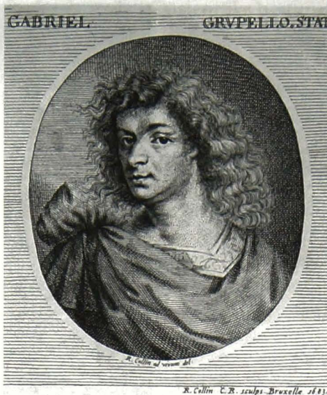
Grupello gegraveerd door R. Collin te Brussel in 1683 uit Sandrarts Akademie.

Coninckstabel (ook gespeld Coninck, Konestabel) aangesteld, die veeleer als erevoorzitter en sponsor van bepaalde feestelijkheden werd aangehouden (21) .