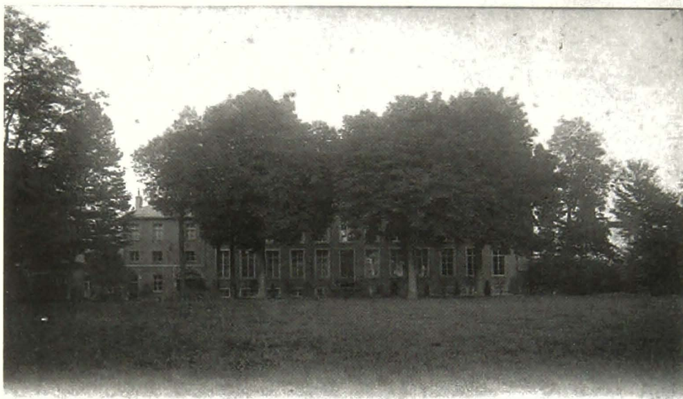
Souvenir de Grimminge. — Le Château de Beau-Pré.