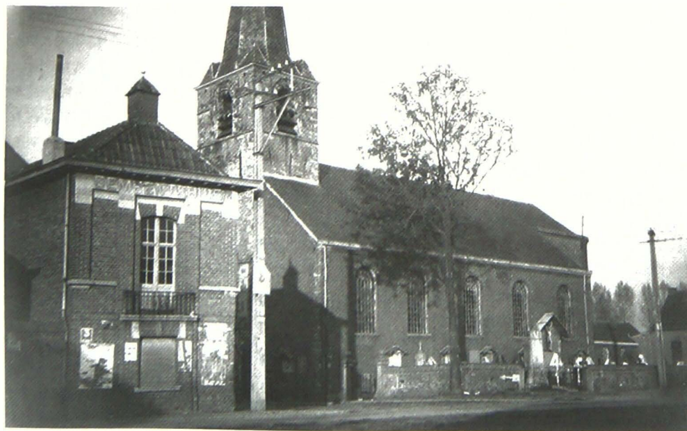
De kerk en het gemeentehuis in 1958