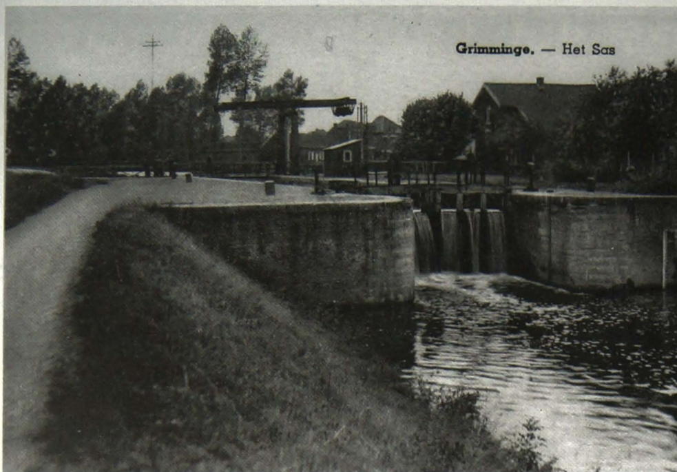
Het sas aan de zijde van Grimminge in 1950