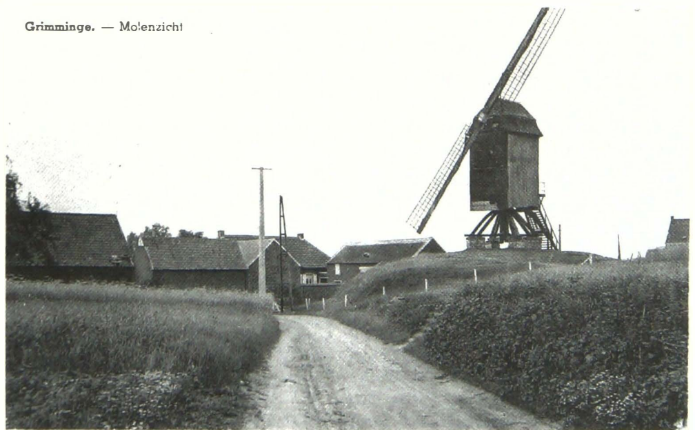
Deze molen wordt reeds in 1354 vermeld als bezit van de abdij van Beaupré. Hij viel in 1951 in puin, nadat hij de laatste jaren van zijn bestaan met slechts twee wieken had gewerkt.