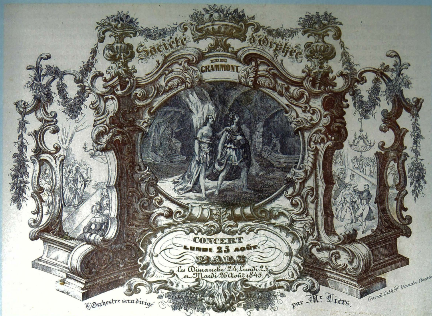
Société d'Orphée de Grammont. Concert Lundi 25 Août. Bals les Dimanches 24, Lundi 25 et Mardi 26 Août 1845. L'orchestre sera dirigé par Mr. Liers. (Gand. Lith. P. Vande Steene)

Bij deze luxueuze uitnodiging werden voor de versiering alle registers open getrokken. De tekst met de aankondiging van het concert en het bal werd ondergeschikt aan de uitbeelding van Orpheus, die van Hades, de koning van de onderwereld, de toelating krijgt om zijn geliefde Eurydice mee te nemen uit het rijk der doden... op voorwaarde dat hij niet naar haar omkijkt. De boot van Charon ligt reeds klaar om de Styx over te varen, maar Orpheus kijkt toch om en verliest voor eeuwig zijn Eurydice. Dit tragische verhaal is in een Delfts blauwe gravure uitgebeeld; Orpheus en Eurydice staan centraal op de voorgrond in een theatrale houding en, eerder wazig achteraan zien we Hades en Charon. Voor de barokke omkadering werd nu gekozen voor een drieluik dat zeer knap in perspectief werd uitgevoerd. De zijluiken met de uitbeelding via een doorkijk van een concert en een bal hebben vluchtlijnen die buiten het beeld eindigen. Uit drie sierlijke vazen vloeien weelderig talrijke guirlandes die het geheel binden en een feestelijk tintje geven. De verfijnde arcering zorgt voor een mooie licht- en schaduwwerking in het imposante decor. Een meesterwerk in zijn genre.