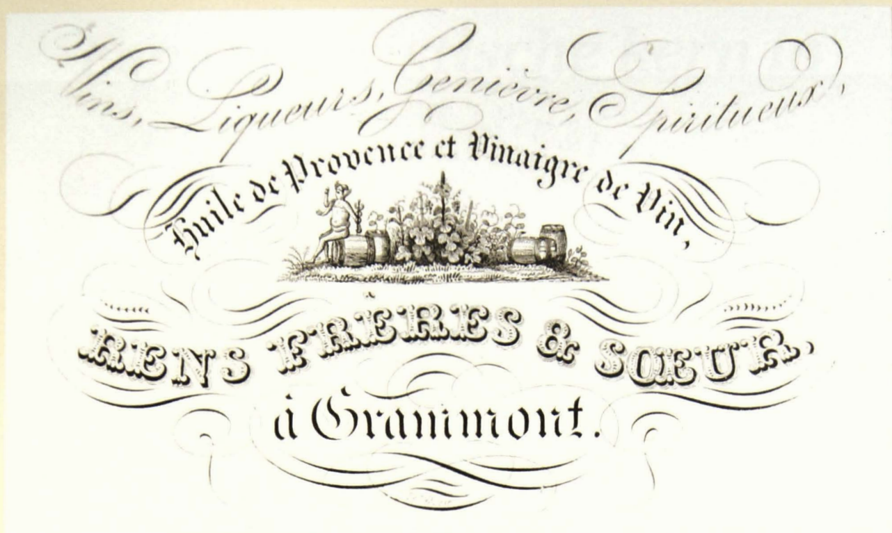
Vins, Liqueurs, Genièvre, Spiritueux, Huile de Provence et Vinaigre de Vin, Rens Frères & Sœur, à Grammont (De Lahoese.)