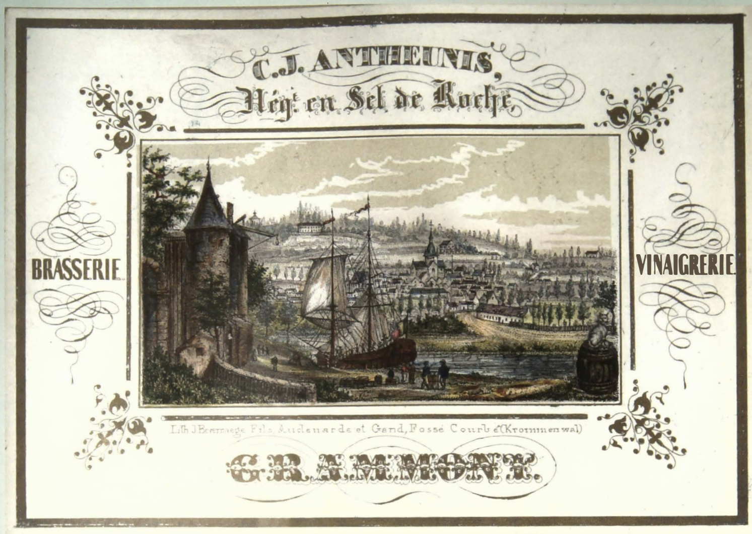
C. J. Antheunis; Négt. en Sel de Roche, Brasserie. Vinaigrerie. Grammont. (Lith. J. Bevernaege Fils, Audenarde et Gand, Fossé Courbé (Krommenwal) (3 varianten)

Dit is een merkwaardige kaart waarop er geen beeld wordt gegeven van bedrijfsgebouwen maar eerder gekozen werd voor een gezicht op de Dender met aanlegkaai en aangemeerd zeilschip. De achtergrond wordt volledig ingenomen door een breed panorama van de stad waarop duidelijk, de kerk, het stadhuis, de kapel op de Oudenberg en de helling van de Buizemont te zien zijn. De toren op de voorgrond is waarschijnlijk een verwijzing naar een versterkte stadspoort, waaraan ook de hijskranen te zien zijn, waarmee de schepen geladen en gelost werden. De kat op de bierton in de rechterhoek verwijst naar de brouwerij met die naam in de Grotestraat. Er werd ook gebruik gemaakt van het kleurenperspectief: het schip met vlag en de toren worden beheerst door het rood en gele oker; de Dendervallei als middenplan wordt in een groene middentoon weergegeven en de achtergrond zinkt weg in blauwe en grijze tonen. De lucht met gestileerde wolken zorgt voor de nodige doorkijk in de ruimte; het geheel is mooi maar sober omkaderd met vergulde letters en hoekversieringen.