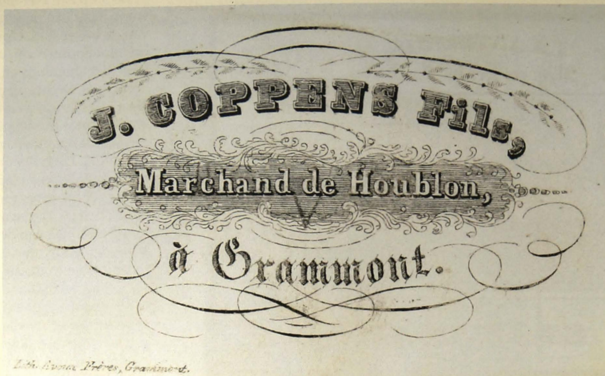
Lith. Avoux Frères, Grammont. J. Coppens Fils, Marchand de Houblon, à Grammont. (Lith. Avoux Frères, Grammont.)

De kaart van hophandelaar Coppens is een mooi voorbeeld van versobering in de uitvoering. Geen afbeeldingen maar wel veel aandacht voor de verschillende lettertypes en de sierlijk gekrulde omlijsting.