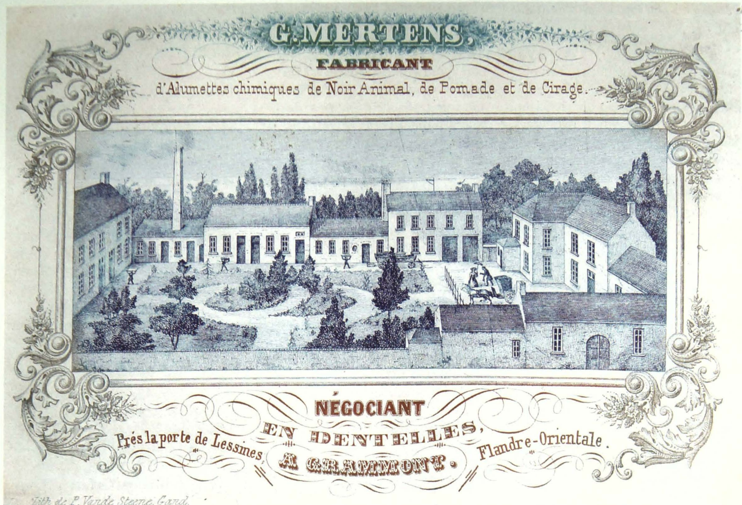
G. Mertens, Fabricant d'Allumettes chimiques, de Noir Animal, de Pomade et de Cirage. Négociant en Dentelles, Près la porte de Lessines, à Grammont. Flandre Orientale. (Lith. De P. Vande Steene, Gand)

Voor deze kaart werd een langwerpig formaat gekozen, zodat het gebouwencomplex binnen het sterk vereenvoudigde kader valt. De rechtervleugel is duidelijk de residentie van de familie Mertens; voor de deur staat een burgerpaar en een ingespannen paard met koets. Achter een afsluiting staan de ateliers waarin het werk goed te zien is. Merkwaardig is de mooi aangelegde tuin tussen de fabrieksgebouwen; die was op de vorige kaarten niet te zien en is misschien wel een romantische aanvulling om het geheel wat op te vrolijken. Opnieuw werden er drie kleuren gebruikt: blauw voor de fabriek en het herenhuis, groen voor de firmanaam en rode oker voor het adres en de geproduceerde waren. Het kader is lichtgrijs gehouden en alleen in de hoeken met gestileerde bladmotieven versierd.