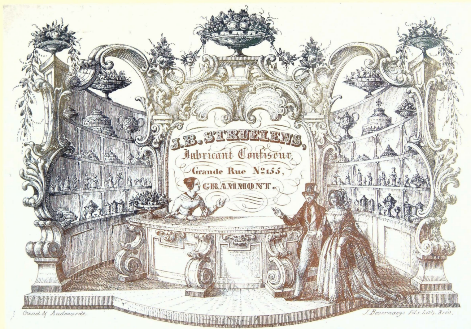
J.B. Struelens, Fabricant Confiseur, Grande Rue N° 155, Grammont. (Gand & Audenarde, J. Bevernaege Fils Lith. Brev.)

J.B. Struelens heeft er de voorkeur aan gegeven om zijn winkel met toonbank en stapelrekken in een theatrale formule te presenteren. Het centrale gedeelte is in rode oker uitgevoerd en toont een burgerpaar dat de winkel betreedt. Het geheel is als een theaterdecor opgevat, waarbij nog eens extra barokke motieven uit de kast werden gehaald. Het gearceerde blauw zorgt voor de nodige schaduw effecten en geeft ook meer diepte aan de winkelruimte.