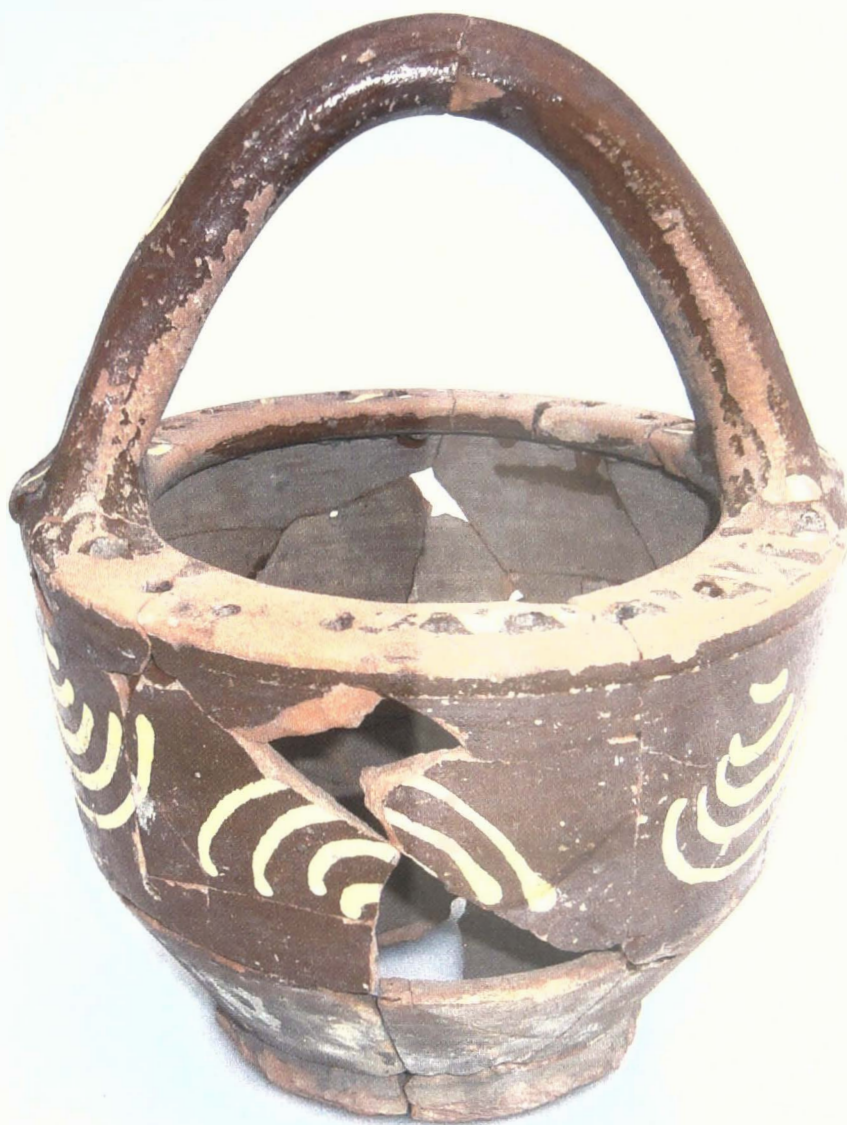
De 18de- eeuwse lollepot uit Geraardsbergen.

De lollepot is vervaardigd in rood gebakken aardewerk (hoogte: 240 mm en breedte: 185 mm). De licht uitgezette voet draagt een conische buik en een cilindervormig lichaam. Het worstvormig oor is bij de bevestiging aan het lichaam een weinig platgedrukt. De haaks ingeplooid rand is voorzien van een twintigtal perforaties dat vóór het bakken is aangebracht. Het hengel en het bovenlichaam zijn bezet met loodglazuur en gele slipversiering. Op het lichaam zijn in deze techniek boogvormige motieven aangebracht, terwijl de rand en het hengel met een meandermotief zijn versierd. Heel typisch zijn het hengel en de perforaties. Deze openingen zorgden voor zuurstoftoevoer, zodat de houtskool niet doofde.