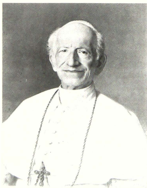
Paus Leo XIII