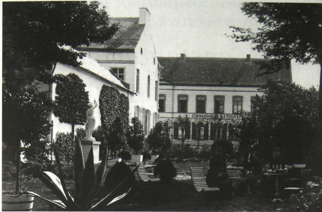
Een drink tussen het groen in de tuin van August Van Santen, rechtover de toenmalige Gendarmerie, eind 19de eeuw.

Pieter VAN SANTEN , geboren in Geraardsbergen op 30 januari 1692 en er overleden op 6 mei 1764. Bezat te Voorde een leen van 2 dag-