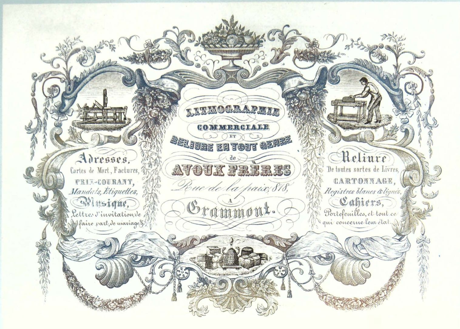
Lithographie commerciale et reliure en tout genre de Avoux Frères Rue de la Paix 818, à Grammont. Adresses, Cartes de Morts, Factures, PRIX-COURANT, Mandats, Etiquettes, Musique, Lettres d'invitation, de faire part de mariages. Reliure de toutes sortes de Livres, Cartonnage, Registres blancs & lignés, Cahiers, Portefeuilles, et tout ce qui concerne leur état. (A. Avoux)

Deze kaart voor de drukkerij van Avoux is zeer decoratief uitgewerkt zodanig dat de vermelding van naam, adres en de geleverde producten zelfs ietwat verloren lopen tussen al te weelderige versieringen die in een blauwe tint werden afgedrukt. Alleen de naam "Avoux Frères" is met enkele aansluitende guirlandes in een getemperde rode oker uitgevoerd. De decoratieve elementen, o.a. schelpen, voluten, hoorns des overvloeds, enz.... zijn bekende rococomotieven aangevuld met enkele luchtige romantische accenten. In de linker- en rechterbovenhoek wordt een drukpers en werktafel afgebeeld. Onderaan wordt centraal de bijenkorf en de mercuriusstaf, naast verpakte goederen, weergegeven om de bedrijvigheid van de zaakvoerders nog eens extra te onderstrepen. Deze kaart wil in haar overvloed aan technische hoogstandjes een uithangbord zijn voor het vakmanschap van de firma Avoux.