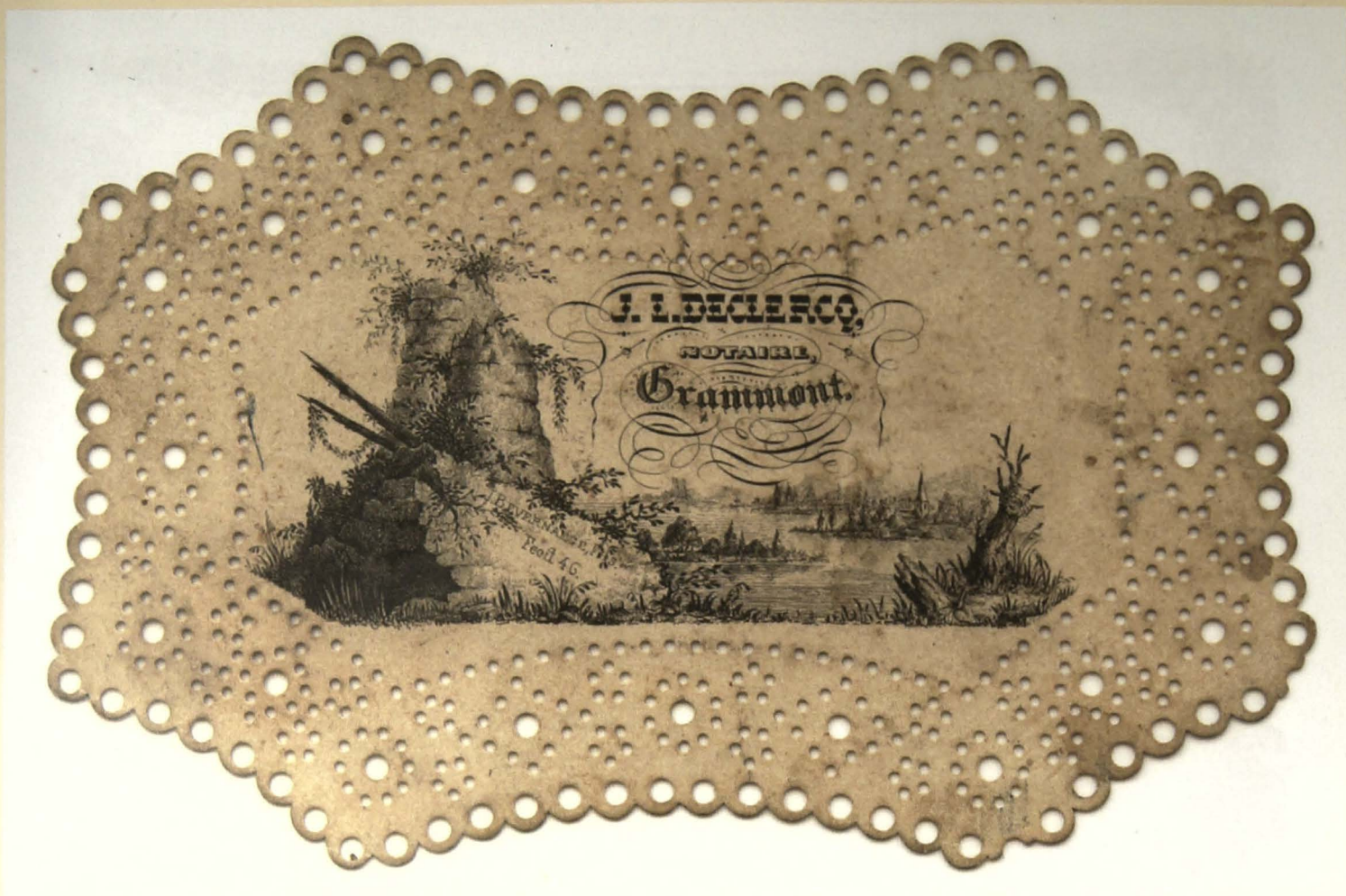
J. L. Declercq, notaire, Grammont (J. Bevernaege, Fils, Fecil 46)

Voor zijn naamkaartje gaf notaris J.L. Declercq de voorkeur aan een romantisch getekend landschap dat wel grotendeels de vrucht is van een nostalgische verbeelding. Met een overgroeide torenruïne en een afgeknakte knotwilg op de voorgrond, zien we een idyllisch rivierlandschap opduiken met langs de oevers enkele stemmige dorpjes rond de kerktoren. Boven de horizonlijn prijkt naam en adres van de notaris in een sierlijke kalligrafische uitvoering. Het geheel is afgedrukt op een geperforeerd wit karton, dat duidelijk geïnspireerd is op een model dat in kant was uitgewerkt. Door zachte grijsovergangen is er een zeer subtiele maar duidelijke modellering gerealiseerd, zowel in de tekening van de ruïne als van de bomen in het landschap.