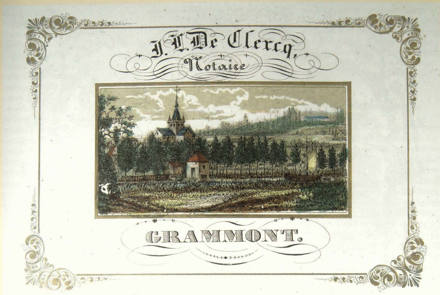
J. L. De Clercq notaire Grammont (2 varianten)

Dit is een boeiend beeld van het "sas" omstreeks 1850 met daarnaast wellicht de gebouwen van de molens en de schotbalken om het waterpeil onder controle te houden. Een rij bomen verbergt het normale zicht op de Markt en de Molenstraat; alleen de staande wip van de Dierkost en de hoofdkerk steken er boven uit. Ook het gezicht op de Oudenberg en de Buizemont is duidelijk het product van de verbeelding. Deze gekleurde litho is weliswaar met het oog van een schilder opgebouwd. Op de voorgrond fungeert de haast witte weide van de beek als voorgrond-element. Op het middenplan zien we de Dender met een zeilboot en het molenhuis met rood piramidaal dak. Samen met de hoofdkerk staat het in de compositie op het snijpunt van de gulden snede. Ook de bomenrij ligt op de horizontale krachtlijn binnen de vlakverdeling. Twee tinten blauwgroen zorgen voor de nodige diepte tussen de struiken op de voorgrond en de begroeiing aan de horizon. In de lucht zorgen witte wolkenlierten voor een mooie doorkijk en de nodige diepte. Bruine en gele okertonen vormen de neutrale basistonen waarop de andere kleurelementen werden aangebracht. Het naamkaartje wordt discreet afgewerkt met een sobere kalligrafische uitvoering van het adres. Ook het kader is beperkt tot een gouden lijntje met sobere hoekversiering.