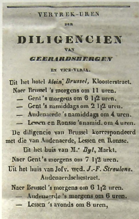
"Vertrek-uren der diligencien van Geraardsbergen", in De Volksverdediger van 25 oktober 1846..