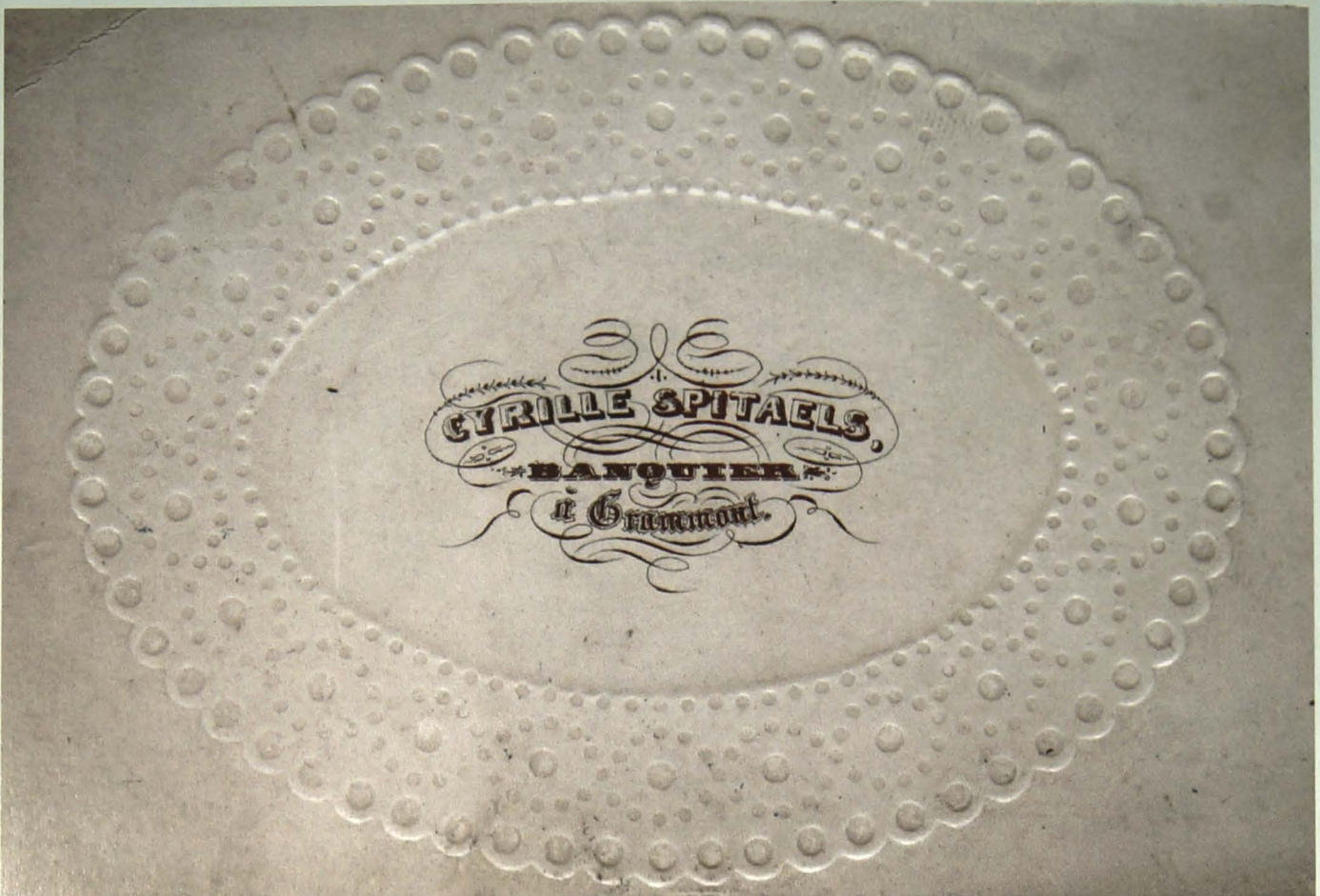
Cyrille Spitaels. Banquier à Grammont. (2 varianten)

Cyrille Spitaels houdt het sober. Een witte naamkaart met een ovale kanten boord en daarin centraal zijn naam en adres in een eenvoudige maar voorname kalligrafische uitvoering. Naast de drie verschillende lettertypes is er ook bij de versiering gezorgd voor een sierlijke maar klassieke lijnvoering. Het geheel werd uitgevoerd in een discrete rode oker.