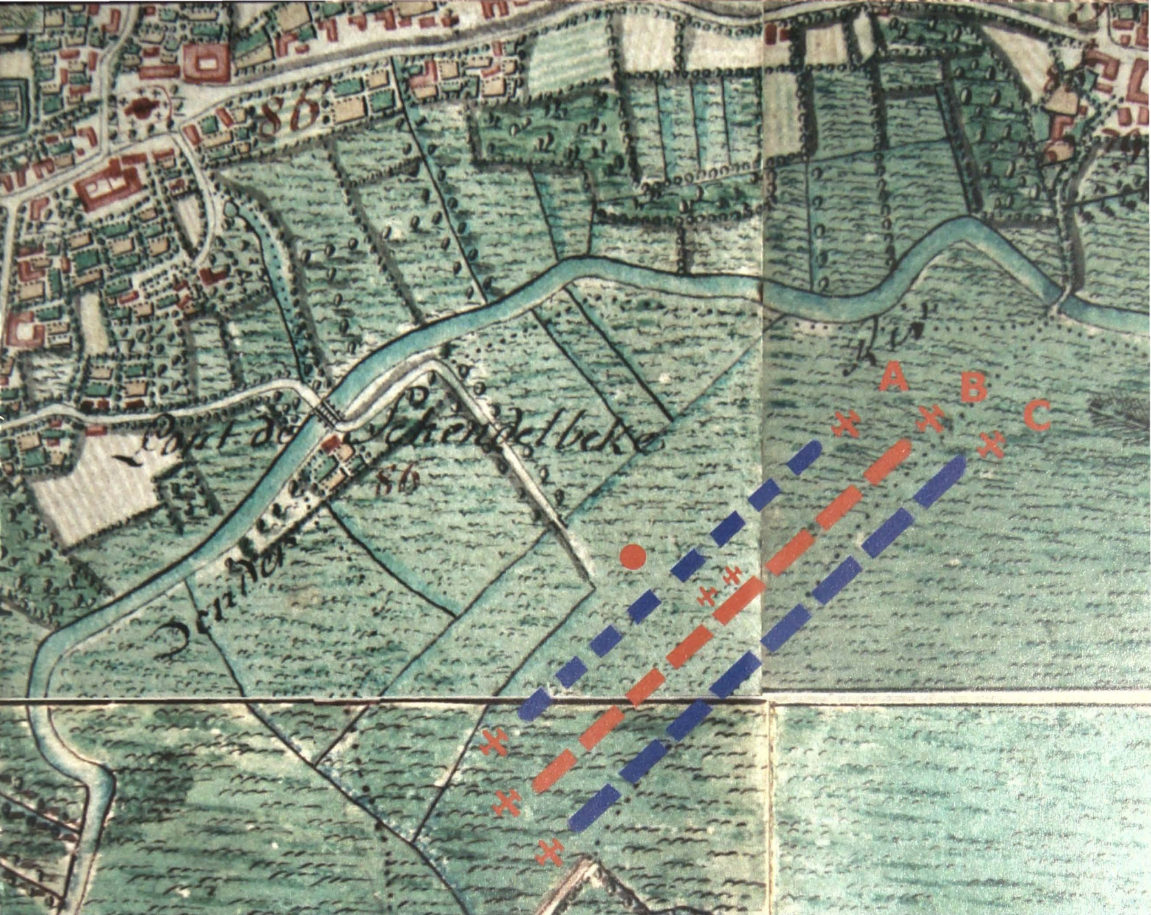
Hypotetisch schema van de parade op de ferrariskaart. A: Huzaren, B: zware dragonders in rood uniform, C: Lichte Dragonders in blauw uniform, telkens geflankeerd door kanonnen aangeduid met H . De rode stip ● is het begroetingspunt.

troepenschouw in Onkerzele met de nodige kleur als volgt te beschrijven: