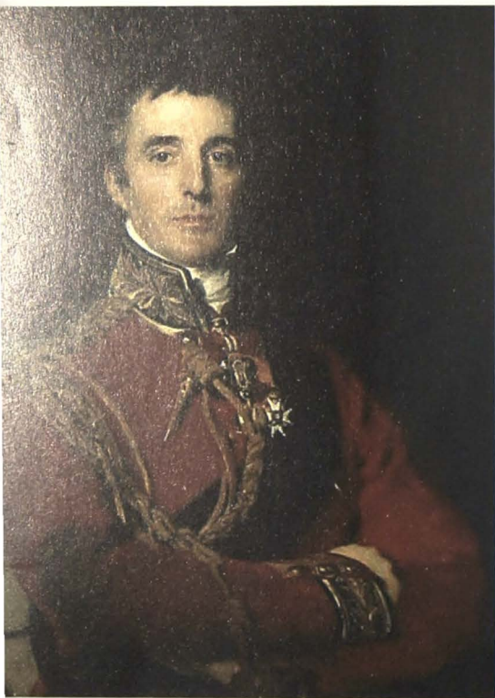
Veldmaarschalk Arthur Wellesley, hertog van Wellington, (door Thomas Lawrence)