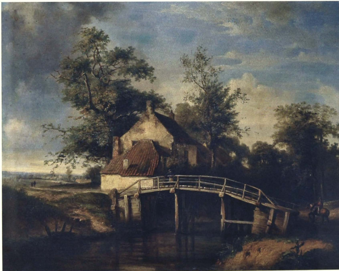
De herberg "t Schipke" zoals deze eruit zag in het begin van de 19 e eeuw, door Idefons Stocquaert. Een ruiter nadert vanuit Schendelbeke om het brugje over te steken naar Onkerzele. Links zien we de Gavermeersen waar de parade plaats vond.

Deze tekst getuigt van zijn gevoeligheid voor de poëzie van het landschap en ook van zijn ruime kennis van de schilderkunst. Het valt hem op