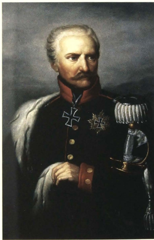
Veldmaarschalk Gebhard Leberecht von Blücher, (door Paul Ernst Gebauer)