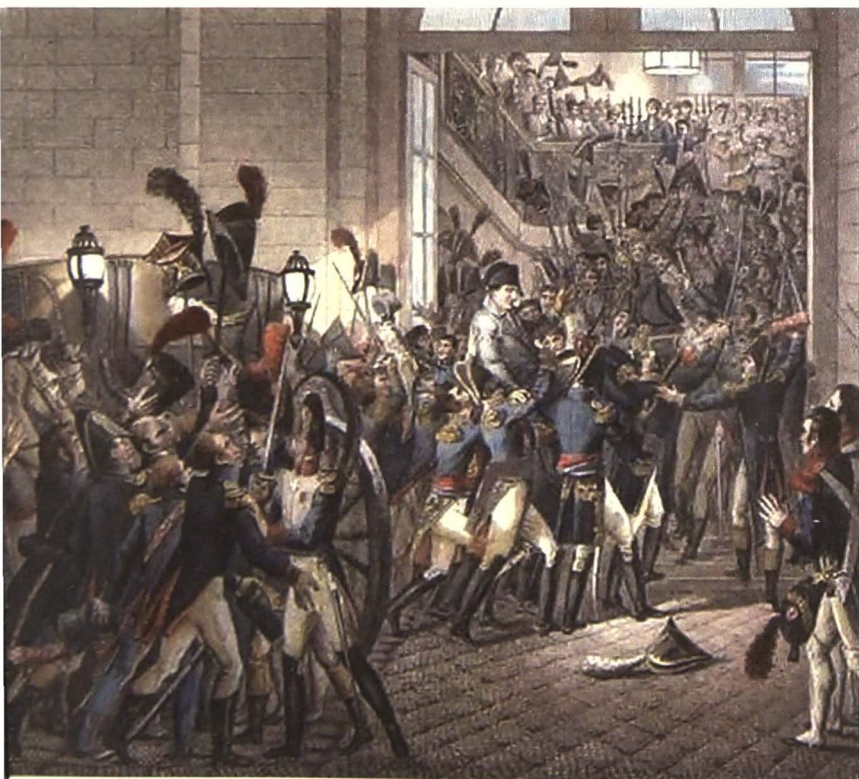
Het uitbundig onthaal van Napoleon in de Tuilerieën na zijn terugkeer uit Elba. (Afbeelding Francois-Joseph Heim)

Napoleon ontsnapt uit Elba, verjaagt Lodewijk XVIII en brengt opnieuw een leger van 200.000 man op de been