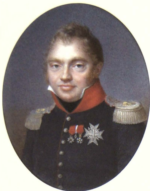
De hertog van Berry, Charles Ferdinand de Bourbon (door J.-B. Augustin).