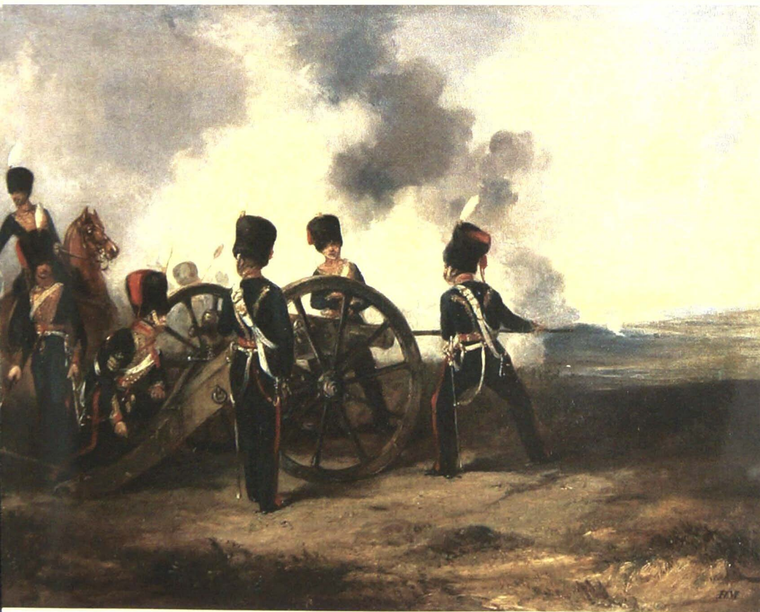
Afbeelding van The Royal Horse Artillery (Henry Martens, National Army Museum)

hij kort en bondig zijn persoonlijke mening over de historische waarde van zijn tekst... Hij schrijft: "Ik beweert absoluut niet een wetenschappelijk verslag te schrijven van de grote veldslag, die over het lot van Europa besliste. Ik schrijf geen geschiedenis noch memoires in dienst van de geschiedenis" (...), maar alleen wat losse notities voor mijn persoonlijk genoegen; alleen datgene wat mij en de mijnen overkwam, en wat ik heb zien gebeuren met anderen rondom mij. Wees ervan overtuigd, dat hij, die beweert u een breed verslag te geven van een grote veldslag vanuit zijn eigen beperkte ervaringen, u bedriegt - geloof hem niet. Hij kan (wanneer hij er persoonlijk bij betrokken is) niet verder kijken dan zijn neus lang is; hoe zal hij u immers vertellen wat er drie of vier mijlen verder gebeurt en waarvan het zicht gehinderd wordt door heuvels, bomen en een alles verhuullende rook?" ("). Mercer heeft dus niet de pretentie om een totaalbeeld met zijn verhaal te geven; hij legt er de nadruk op dat hij alleen een verslag wil schrijven van de vele gebeurtenissen die hij zelf meemaakt heeft en waarover hij aldus met kennis van zaken kan getuigen. Deze aanpak bezorgt de tekst dan ook een verbluffende rijkdom aan meesterlijk beschreven acties tijdens zijn tocht door onze gewesten. Als schilder bekeek hij ook de landschappen die