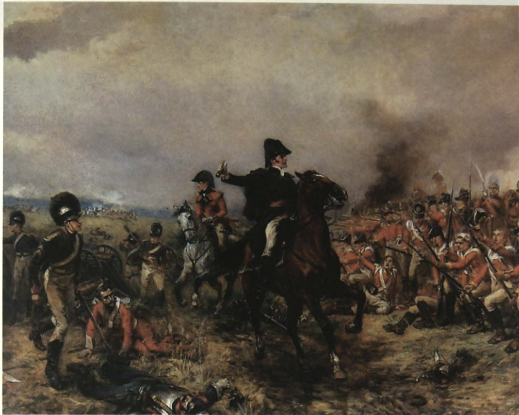
Mercers Royal Horse Artillery is te zien op de linkerkzijde van het schilderij The Battle of Waterloo van Robert Alexander Hillingford (1815). Rechts zien we de Foot Guards (in het rood) en centraal Wellington.

Op 16 juni rond de middag krijgt hij een brief met het bevel om zich met zijn troepen naar Braine-le-Comte te begeven, omdat Napoleon in Charleroi de Sambre was overgestoken en de aanval had ingezet (15) . Ook voor Mercer was dit het begin van een bewogen tocht naar Edingen, 's Gravenbrakel en Nijvel... waar hij vernam dat de slag bij Quatre Bras reeds geleverd was en de Engelse troepen aan een strategische terugtocht naar Waterloo begonnen waren. Hij kon alleen met zijn kanonnen helpen om de aftocht te dekken. In de gietende regen bracht hij met zijn batterij de nacht door, dicht bij de hoeve van Mont Saint Jean. 's Anderendaags had hij een groot aandeel in de uiteindelijke overwinning. Tegen het bevel van Wellington in om