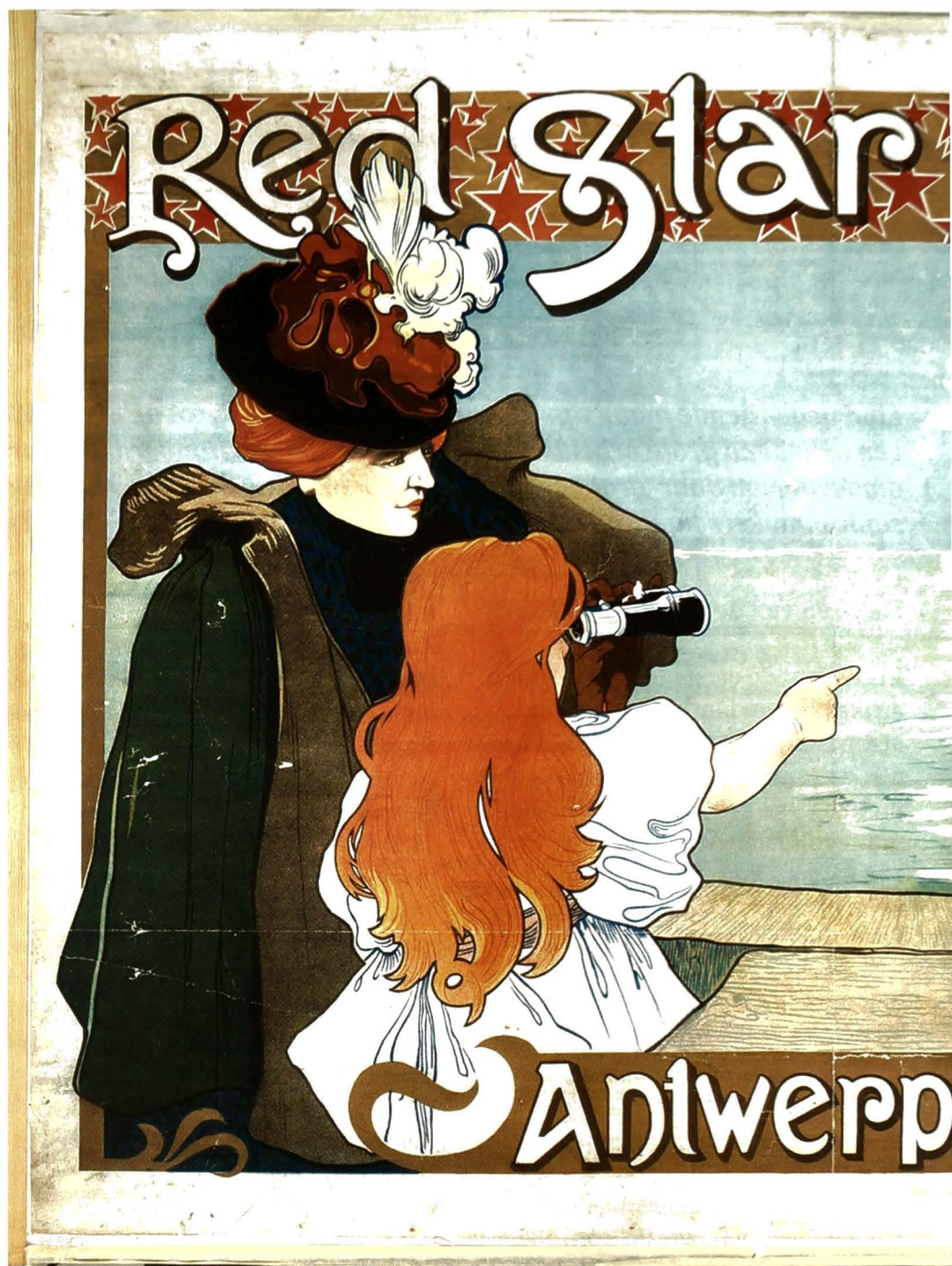
Henri Cassiers. Affiche Red Star Line, Antwerpen – New York, 1898 (Verzameling Vleeshuis, Antwerpen. Affiche d'Art O. De Rycker, reproductie Uitg. Pandora)

Een document dat ons heel wat gegevens verschaft over de sigarenmaker zelf is het Original Ship Manifest , de passagierslijst die bij elke overtocht wordt bijgehouden. In deze lijsten worden niet enkel de passagiers vermeld maar ook hun beroep, wat hun eindbestemming is, bij wie ze onderdak zullen vinden en enkele fysische kenmerken, zoals kleur van ogen, haar enz.. Deze lijsten zijn digitaal omgezet zodat men (enkel) op familienaam kan zoeken. 5 Helaas is deze transcriptie zo slordig uitgevoerd dat het vinden van een familienaam of een gemeente haast