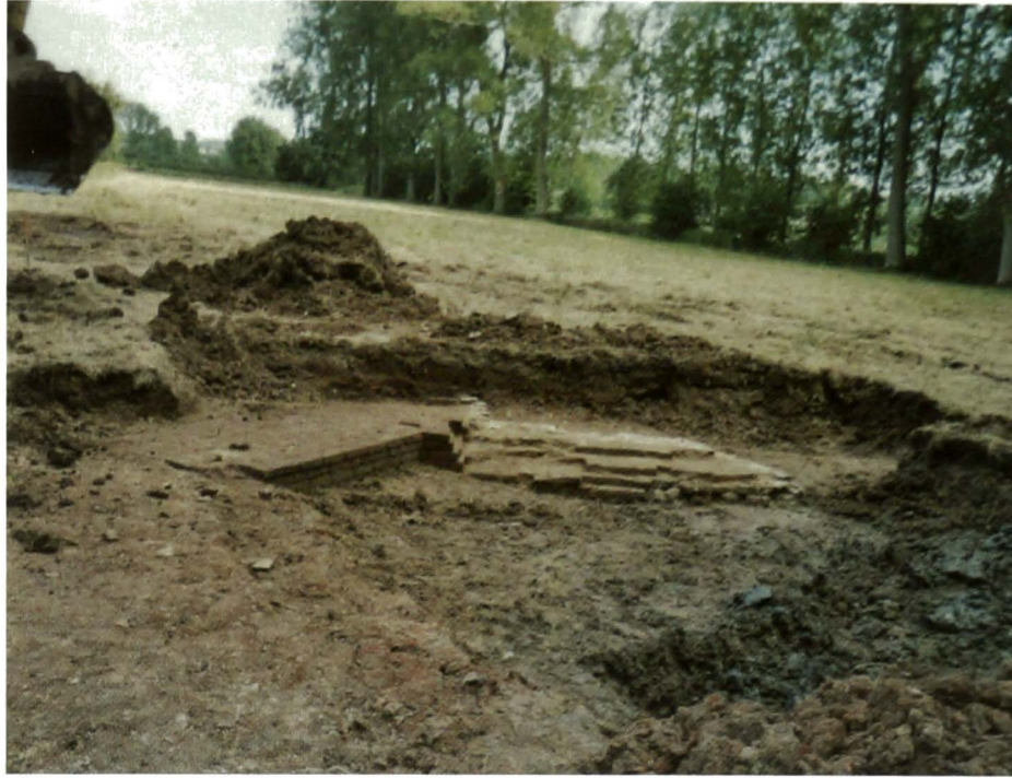
Boven: toren van het kasteel van Schendelbeke, gevonden bij het archeologisch onderzoek in 2009