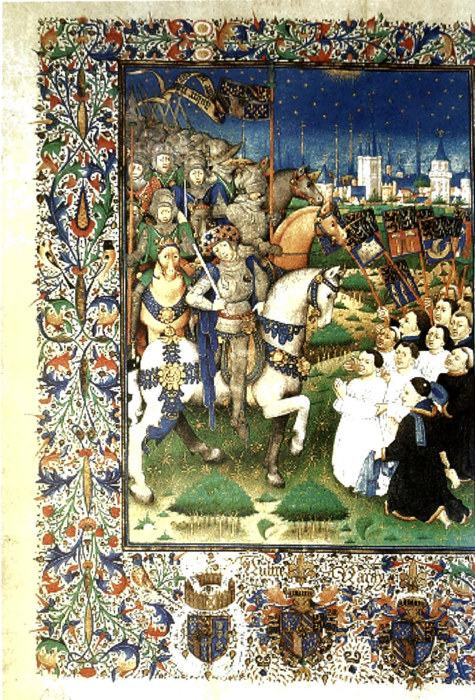
DE OVERGAVE VAN GENT IN 1453. Burgers smeken blootshoofds, blootvoets en in tabbaard de hertog twee mijlen buiten de stadsmuren op hun knieën om genade. (Volbladminiatur van 1458 in een handschrift in Wenen)

dat onmatelijck ware ende onghelooffelijc te seggene'. 4 Onmiddellijk na de aftocht van de hertogelijke troepen keerden de Gentenaars terug en werd de stad nogmaals geplunderd. Zij vertrokken met hun buit naar Gent 5 . Geraardsbergen bleef ontredderd, berooid en vernietigd achter.