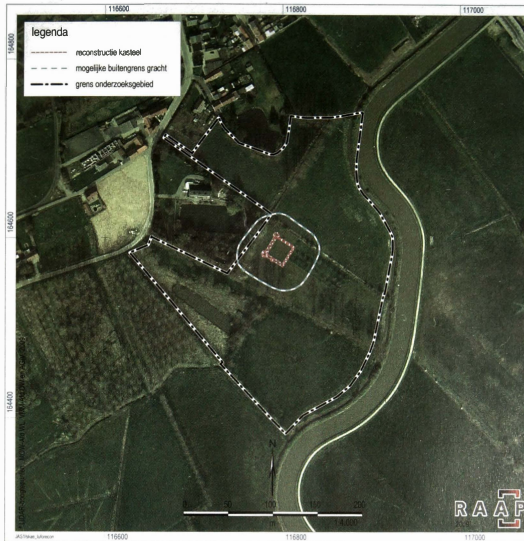
Luchtfoto met daarop geprojecteerd de plattegrond van het kasteel en de gracht (Abeelding uit RAAP-rapport Archeologische evaluatie en waardering van een kasteelsite te Schendelbeke, 2009. Op basis van het rapport van dit onderzoek werd in 2012 de kasteelsite voorlopig beschermd)

zoals men zegt. Het was een stevige strijder en ik betreur het dat ik hem heb laten hangen. Maar daar is hij en ik zou hem toch wat eer willen betonen. Daarom, vrienden, zullen wij hem begraven. Het is niet goed dat de raven zich voeden aan de ingewanden van zo'n moedige soldaat."