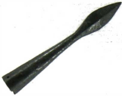
METALEN PIJLPUNT in 1965 gevonden op de kasteelsite (Afbeelding uit M. COCK, F. DE CHOU, Schendelbeke van Prehistorie over Scentlabeke tot heden - Tentoonstellingscatalogus - 1978).

SPRINGAAL waarvan er in 1338 drie stonden opgesteld op de torens van het kasteel van Schendelbeke (lit. J. VAN CLEEMPUT, De oostelijke limes van het Graafschap Vlaanderen in 1338 , in Het Land van Aalst , 1956.)