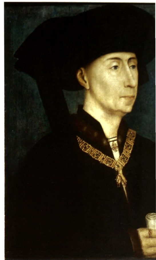
FILIPS DE GOEDE door Rogier van der Weyden

DONDERBUS waarmee het kasteel werd beschoten 'soe dat sy de torren ende de muren t'allen zyde doorschoten', (uit Kronyk van Vlaenderen ) Afbelding van het beleg van het kasteel van Poekel CHASTELLAIN, Le livre des faits de Jacques de Lalaing .