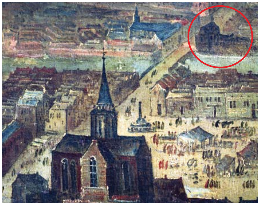
Op de achtergrond omcirkeld: het silhouet van de Sint-Janskapel op het schilderij "Gezicht op Geraardsbergen" van Joos II de Momper (1564-1635) uit circa 1590