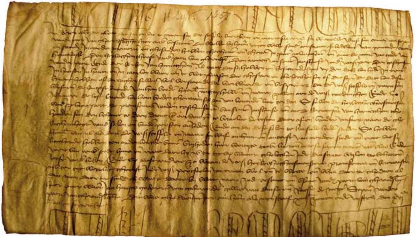
Handvest waarbij Christoffel Lueribout en zijn echtgenote Maria Sizeere al hun bezittingen aan de armen van het Sint-Jansgodshuis, aan de Heilige Geest en aan de kerk van Hunnegem schenken (16 september 1457)

Geraardsbergen een of meer renten op 38 huizen met erf, 2 huizen met tuin, 1 huis, 1 klooster met huizen en erven, 1 stampmolen, 1 schuur, 1 blekerij, 4 boomgaarden, 2 partijen land en 2 velden. In een tiental dorpen krijgt het godshuis renten maar vooral pachtgeld van 1 huis, 3 huizen met erf, 1 huis met tuin, 11 partijen land, 6 weilanden en 3 wijmeniers 7 . In de loop van de 18 de eeuw groeit het aantal eigendommen nog en wordt er ook pachtgeld opgehaald in Vloerzegem, Goeferinge, Akren, Sint-Maria-Lierde, Everbeek en Galmaarden.