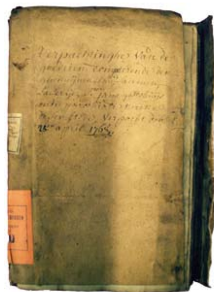
Boek van de “Verpachtinghe van de goederen competerende den ghemeijnen huijsarmen, Laserije, S te jans godtshuijs en de parochiale kercke deser stede, verpacht den 25 den april 1768”

Onder het ancien régime heeft de broederschap van de Heilige Marcoen het genot van de kapel, met als voorwaarde dat hij rekenschap geeft bij de schepenen over de inkomsten uit offergaven, tijdens de diensten en door geldinzamelingen in de stad. Deze heilige is tot in de 18 de eeuw zeer populair en wordt aange-roepen tegen kliergezwollen, vooral in de hals. In de 19 de eeuw staat de kapel volgens G. Merkaert nog lang bekend als Sint-Markoen . 14