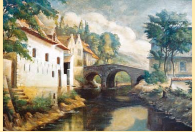
Op de litho van J. Hoolans en het latere schilderij van fotograaf Théophile L'Haire zien we op de achtergrond rechts een deel van de Sint-Janskapel