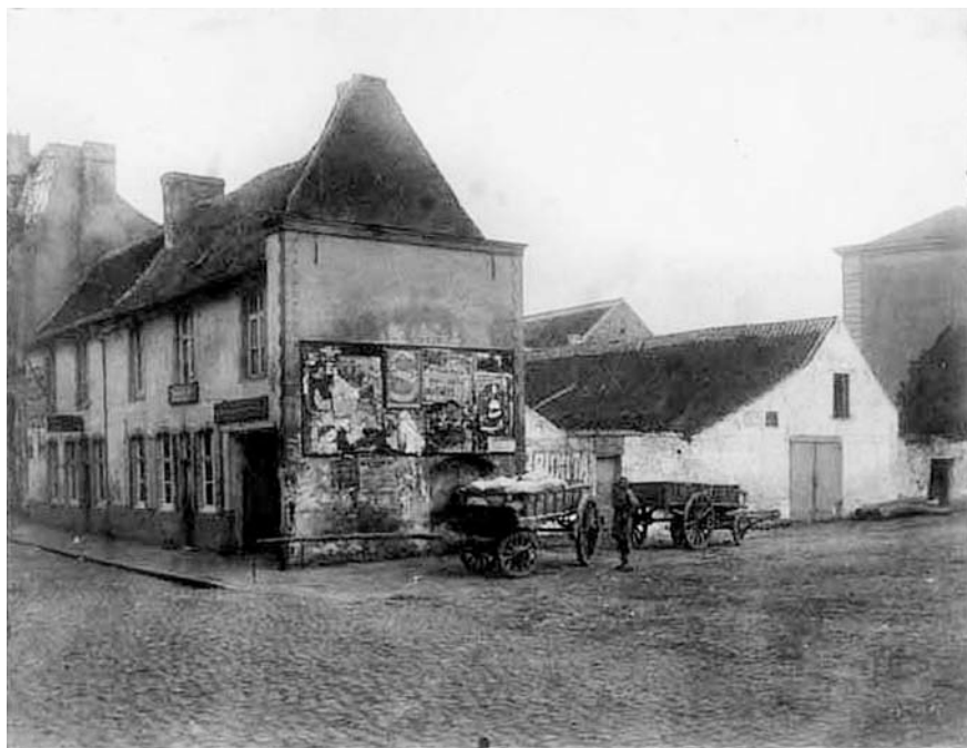
De voorgevel van de Sint-Janskapel blijft nog lange tijd behouden, wellicht om de aangebouwde woning te stabiliseren (ongedateerd)

De rondboogvormige vensters met glasramen zijn manskroot. We zien op de nok van het zadeldak met leien van de voorgevel de aanzet van een kleine klokkentoren met dakruiter. De vraag kan gesteld worden of dit schilderij van L'Haire een getrouwe weergave is van de werkelijkheid. Volgens P. Haegeman zou dit schilderij gebaseerd zijn op een oude foto. Toch zijn er ook veel gelijkenissen te vinden met de litho van J. Hoolans uit 1849, waarop enkel de zijgevel van de kapel ontbreekt. Op het andere schilderij van L'Haire, waarbij eveneens een foto als voorbeeld heeft gediend, zien we een zicht op de Dender en de Nieuwe Brug (thans Wijngaardbrug). Dit stadsgezicht moet gedateerd worden voor 1855, gezien de stenen brug in dat jaar is vervangen door een draaibrug. Rechts van de brug zien we ditmaal de noor-