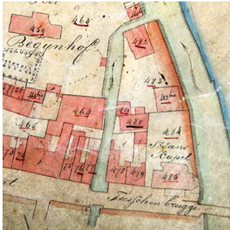
Situering van het Sint-Jansgodshuis op het primitieve kadasterplan van Geraardsbergen uit 1828

Het godshuis (in het Frans Maison de Dieu , Hotel de Dieu , in het Engels Hospice ) functioneert tijdens de volle middeleeuwen als een liefdadigheidsinstelling waar om Gods wil armen, zieken en ouderen worden verzorgd. Het kan ook worden aangezien als een gebouw voor de eredienst, een kerkgebouw of tempel. Godshuizen ontstaan bij de prille stadsontwikkeling als hospitalen aan de stadspoorten, waar arme passanten of kloosterlingen onderdak kunnen krijgen, soms voor één nacht, wanneer de stadspoorten al gesloten zijn. Hoewel het stichtingsjaar niet gekend is, vermoeden we dat het Sinte Jans Godshuys bij de zuidelijke uitbreiding van de bovenstad in de loop van