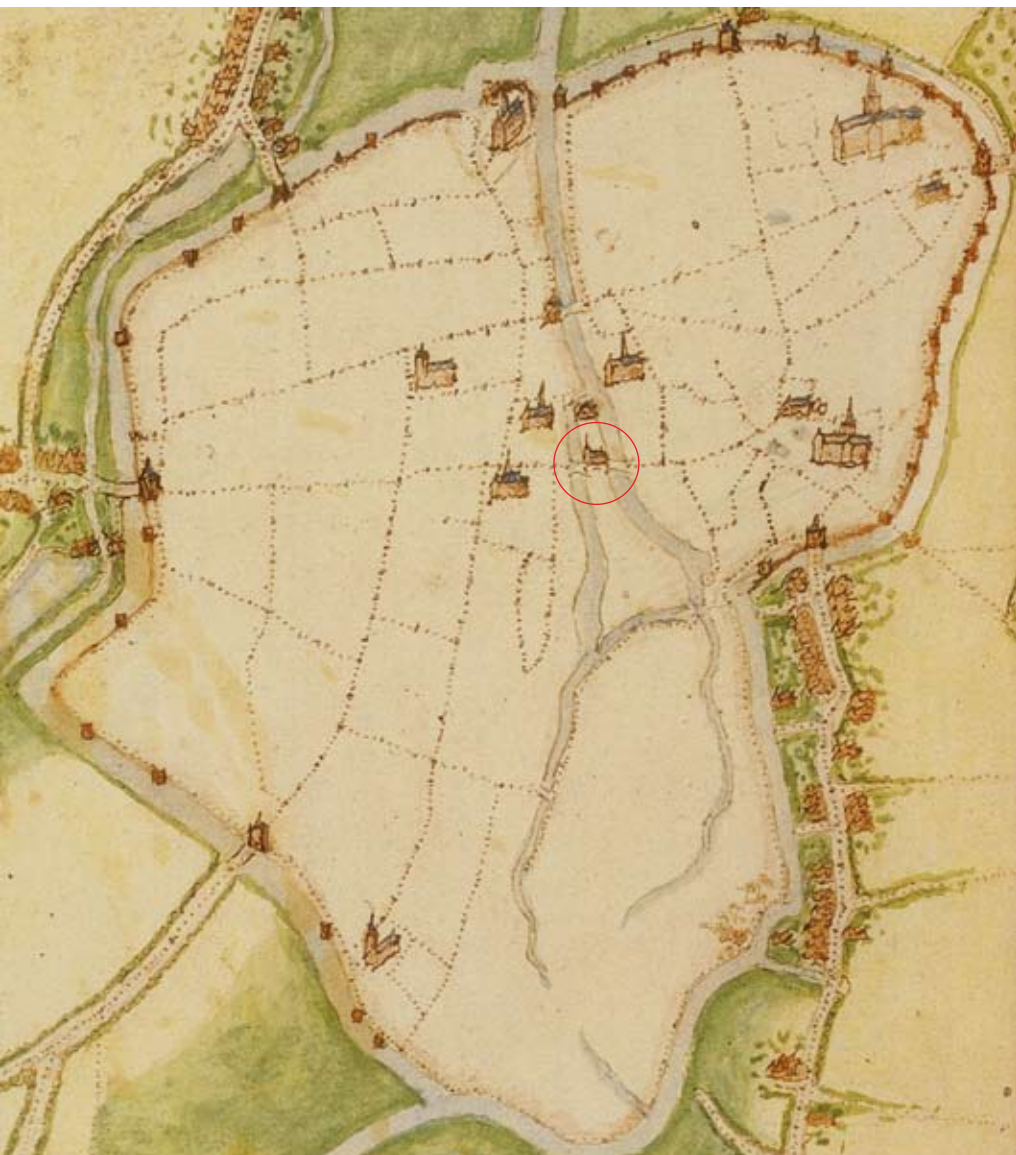
Op de bijkarta van het stadsplan van Geraardsbergen van Jacob van Deventer uit circa 1560 staat tussen de bruggen van de Dender en de Kleine Dender het Sint-Jansgodshuis geschetst

remarquable et serant d'une utilité notable pour l'industrie et la commerce ". Tegelijk rekent men met de kaairechten op extra inkomsten.