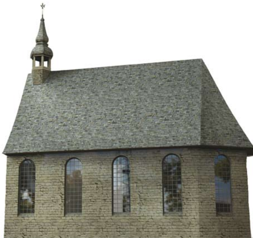
Digitale reconstructie van de zuidzijde van de Sint-Janskapel op basis van de beschikbare iconografische bronnen (Jonas De Ro)

opdracht van de magistraat omgebouwd tot een school: “Van ghelycken is betaelt an diveersche weercklieden so metsers, temmerlieden als andere over 'tgone by laste van Burgemeester ende scepenen ghewrocht is gheweest in 't accomoderen van S t Janshuuse tot een scule conforme de staet specificatyf” . 4