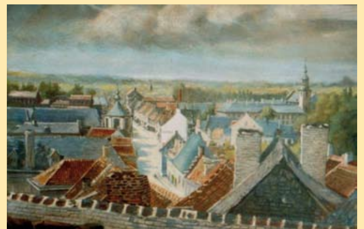
Op nog twee andere schilderijen van Théophile L'Haire is een deel van de Sint-Janskapel (zijgevel en torenspits) te zien (Verz. Ph. Haegeman)