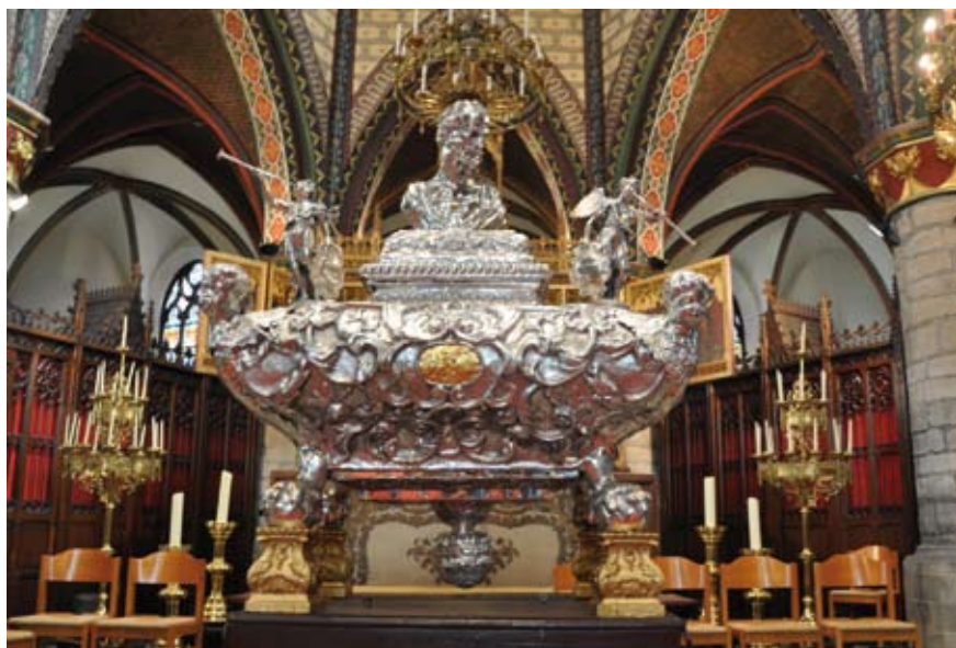
De relieken van de apostel zitten in het verzegelde houten kistje dat in het zilveren reliekschrijn geplaatst wordt

de parochie bekomen dat relieken van de apostel Bartholomeus, die bewaard werden in het kartuizerklooster van Sint-Martens-Lierde, aan Geraardsbergen werden geschonken. In een handvest, dat bewaard wordt in het rijksarchief van Gent, werd de overdracht officieel vastgelegd op 10 juli 1515. 32 Van Waesberghe nam het letterlijk over in zijn Gerardimontium . Uit dit document blijkt alvast dat niet langer de Sint-Lukaskerk, maar de Sint-Bartholomeus de belangrijkste parochiekerk was geworden: de principale Prochie Kercke .