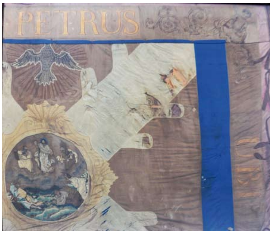
De oude vlag van de rederijderskamer de afbeelding van de Transfiguratie of Verheerlijking van Christus op de berg Thabor

van Atrecht als gilden ingerichte verenigingen ter bevordering van de dichtkunst. Kort daarna volgt ook Doornik (1280). Naar hun voorbeeld ontstonden van de 14 de eeuw af in de Nederlanden broederschappen waarvan de leden zich toelegden op het vervaardigen van poëzie en het opvoeren van toneelwerk. Dit laatste werd geleidelijk hun belangrijkste bedrijvigheid. Deze gezelschappen, veelal rederijderskamers genoemd, werden tegen de 15 de eeuw bekend in Vlaanderen. 15 De Thaboristen , de rederijders van