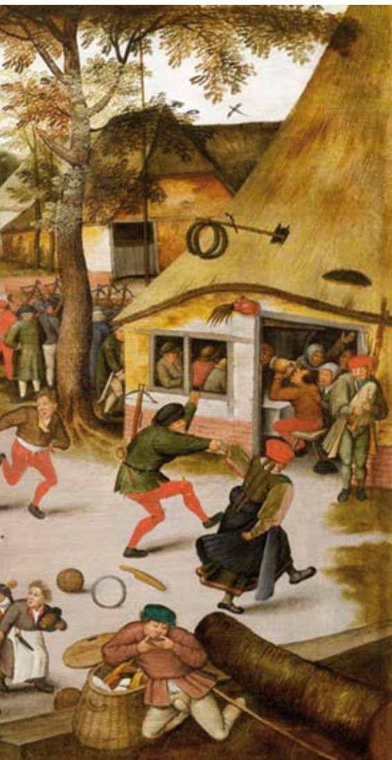
Op oude voorstellingen van kermissen zoals de Sint-Joriskermis van Hoboken, op een mooie prent van Pieter Brueghel III (1589), ziet men helemaal op de achtergrond een processie de kerk binnentrekken terwijl het kruisboogspel van Sint-Joris op het dorpsplein wordt vertoond en de dorpeelingen zich aan volksvermaken overgeven. Hieruit blijkt dat al in de 16de eeuw de betekenis van "kermis" was geëvolueerd tot 'volksfeest', vandaar 'Vlaamse kermis'.