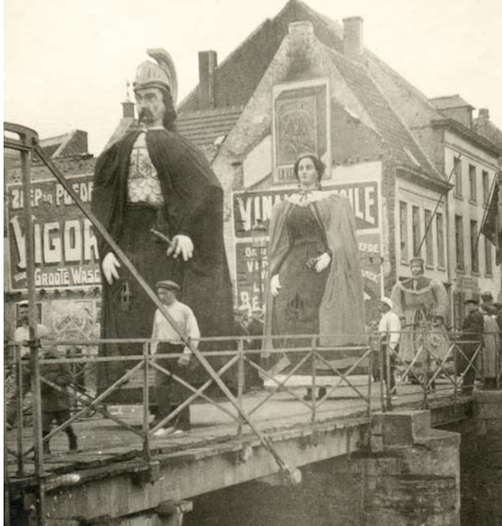
In 1919 gaat, na vijf jaar onderbreking door de "Grooten Oorlog", de processie weer uit. De reuzen stappen over de Wijngaardbrug