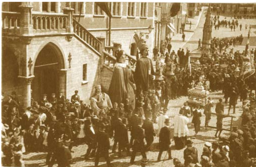
Fotograaf Théophile l'Haire legde begin 20 ste eeuw de aankomst vast van de processie

Sindsdien is het schrijn al enkele keren hersteld. De laatste keer was in maart van dit jaar. De relikien liggen trouwens niet los in het schrijn maar bevinden zich in een rechthoekig houten bakje met schuifdeksel, daarin zit: een kistje met de grote relikwie van Bartholo-meus, overwonden met een wit lint dat verzegeld is langs onder en bo-ven, telkens met twee gelijke zegels welke een hartvormig schild dra-gen, in een omslag een kleine relik met het zegel van de stad Geraards-