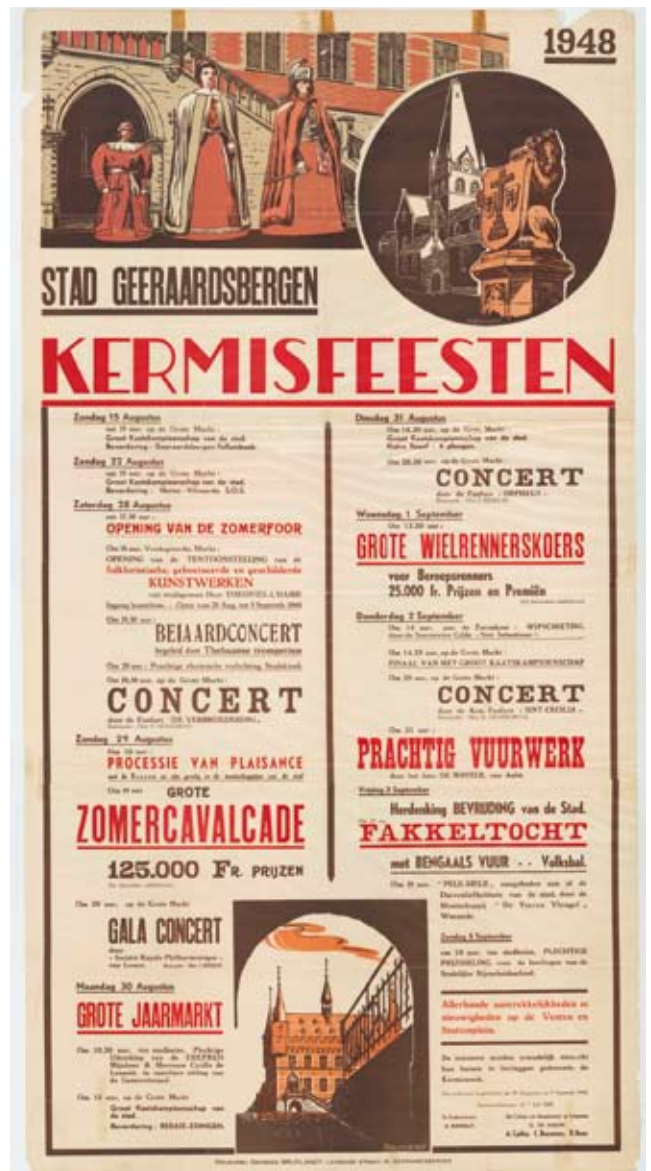
Links de kermisaffiche van 1900 gedrukt bij steendrukkerij Meyer - Van Loo uit Gent. Rechts de kermisaffiche van 1948, met een litho van Theo Bruylant, waar voor het eerst de benaming 'Processie van Plaisance' wordt gebruikt. Op de eerdere kermisaffiches stonden steeds varianten van 'Processie (of Ommegang) van de reuzen en de maatschappijen van de stad'.

aan de huizen tussen de hospitaal-kerk en de Sint-Bartholomeuskerk. De reuzen hadden nummer één vertrokken aan de hospitaalkerk gevolgd door de verenigingen in de Grote-, Brugstraat en de Markt in een strikte volgorde. Het systeem dat in feite momenteel wordt toegepast bij het vertrek van de krakelingenstoet in de Gasthuis- en Hunnegemstraat.