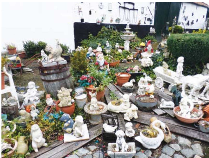
De beeldentuin achter de stallingen van de Kapellehoeve langs de Alfonslaan te Ophasselt. (2015)

Wie meent in het bezit te zijn of kennis heeft van een nog onbekende folly in zijn omgeving, zoals die in deze en in de drie vorige artikels zijn behandeld, neem dan contact op via onderstaand e-mailadres of bel 0475/31.67.98.