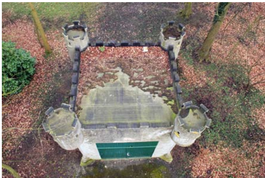
Bovenaanzicht van het follykasteeltje in het abdijpark (2009)

En wellicht zouden we het vergeten, maar in de tweede helft van de 19 de eeuw wordt op het hoogste punt van de Oudenberg een folly geplaatst! Vandaag wordt de zogenaamde Oudenbergkolom algemeen aanvaard als een monument binnen een beschermd landschap. Deze ronde arduinen kolom van vijf meter hoog en bekroond door een dito bol staat op een bloemvormige sokkel en zou het ontwerp zijn van een zekere Ceuterick. Oorsprong en datering zijn betwistbaar. Volgens G. Merkaert (1863-1951) zou het gaan om een van de zuilen van de Lessensepoort die in 1862 als aandenken aan de verdwenen stadspoorten op de heuveltop zijn geplaatst. Nochtans staat de Oudenbergkolom al afgebeeld op het bidprentje ter gelegenheid van een "Bedevaart tot O.L.V. van Bijstand op den Oudenberg te Geeraardsbergen". Deze lithografie is van de hand van Gus-