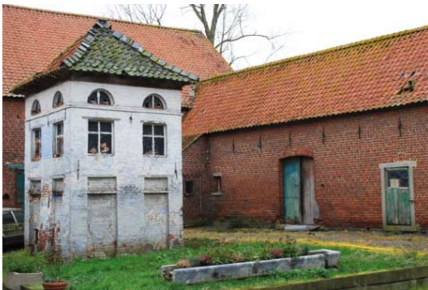
De duiventoren op het boeren erf, Ruisenbroek 4 te Ophasselt (2013)