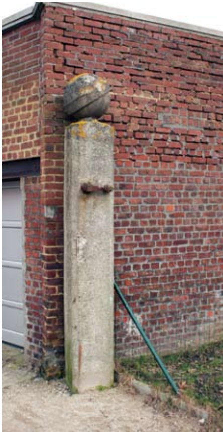
Een van de betonnen pilaren op de hoek van de Hunnegem- met de Gasthuisstraat (2009)

Twee opmerkelijke pilaren van meer recente datum zijn nog te bezichtigen op de hoek van de Hunnegem- met de Gasthuisstraat. Ter hoogte van de Hunnegemkerk in de richting van de vroegere Kleinen Hunnegemkouter - hier stond tot de jaren 1970 het lucifersbedrijf Delaunoit & C e - loopt een wegje dat eertijds moet afgesloten zijn door een hekken. Elk betonnen zuiltje op een achthoekige plattegrond wordt bekroond door een dito bol. Enige gelijkenis qua opbouw met de Oudenbergkolom ligt voor de hand. De bol met rondom een brede band doet ons met enige verbeelding denken aan een planeet met ring.