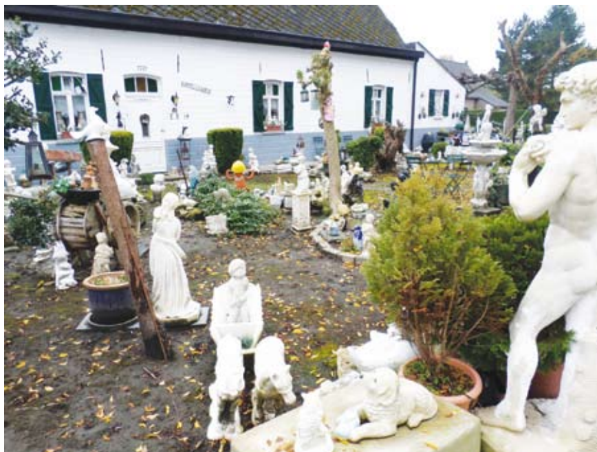
De beeldentuin voor de Kapellehoeve langs de Gote te Ophasselt. (2015)