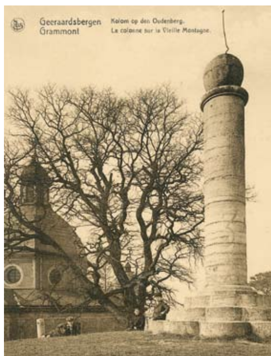
De Oudenbergkolom (Verz. Ph. Haegeman)

uit de arduinen trossen van twee of meer van deze neergehaalde zuilen. Jaarlijks maakt deze folly in februari deel uit van het decor waar de notabelen levende visjes in wijn drinken en krakelingen naar het publiek gooien. 9