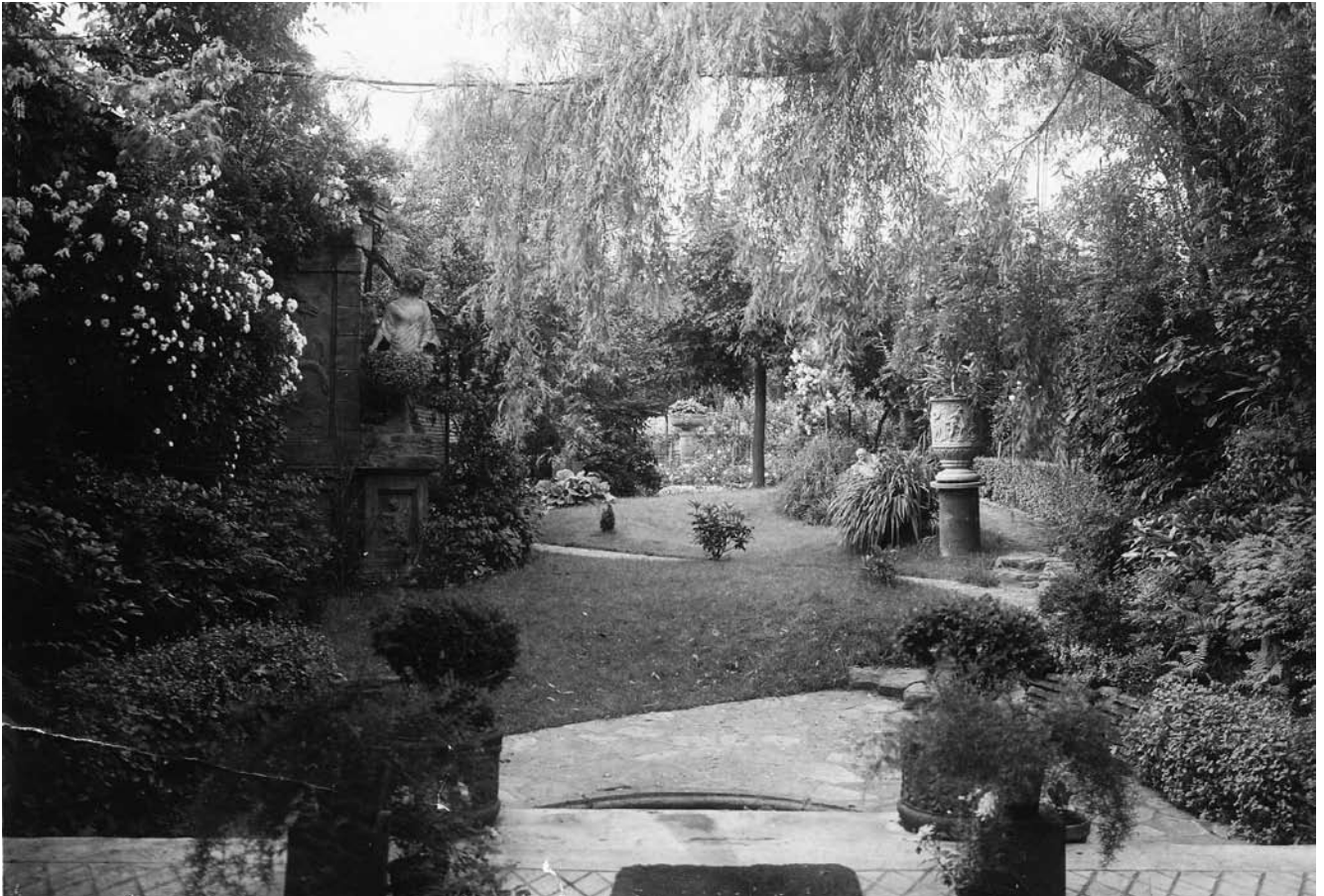
De beeldentuin van Th. L'Haire in de Oudenaardsestraat

het bassin staan bloempotten met telkens rondom vier geboetseerde gezichten.