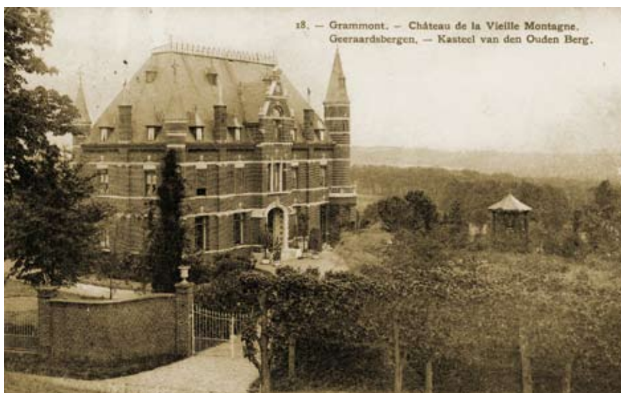
Het houten paviljoen in de tuin van het Oudenbergkasteel (zichtkaart met postmerk 1910)

wanneer notaris Désiré Declercq in 1903-1904 het Oudenbergkasteel een nieuwe facelift geeft. Het is een open houten gebouwtje op een zeshoekige plattegrond onder een tentdak, vermoedelijk met zink afgedekt. Dit frivole beeld dat we vanaf de V.A.B.-oriëntatietafel te zien kregen is helaas reeds geruime tijd verdwenen. 3