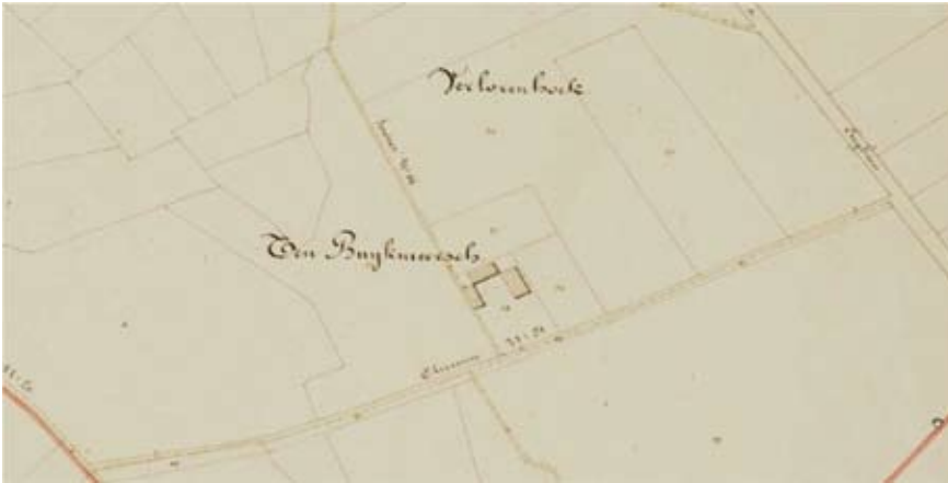
Hof ten Buikmeers - 1844