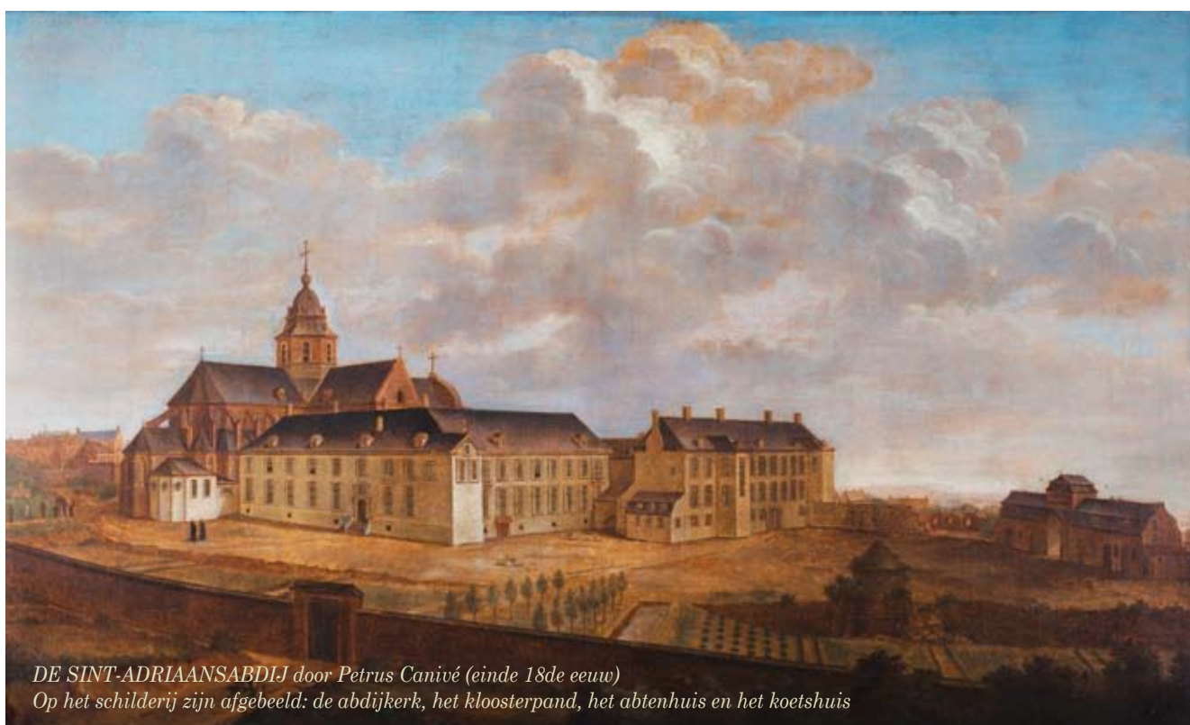
DE SINT-ADRIAANSABDIJ door Petrus Canivé (einde 18de eeuw) Op het schilderij zijn afgebeeld: de abdiijkerk, het kloosterpand, het abtenhuis en het koetshuis