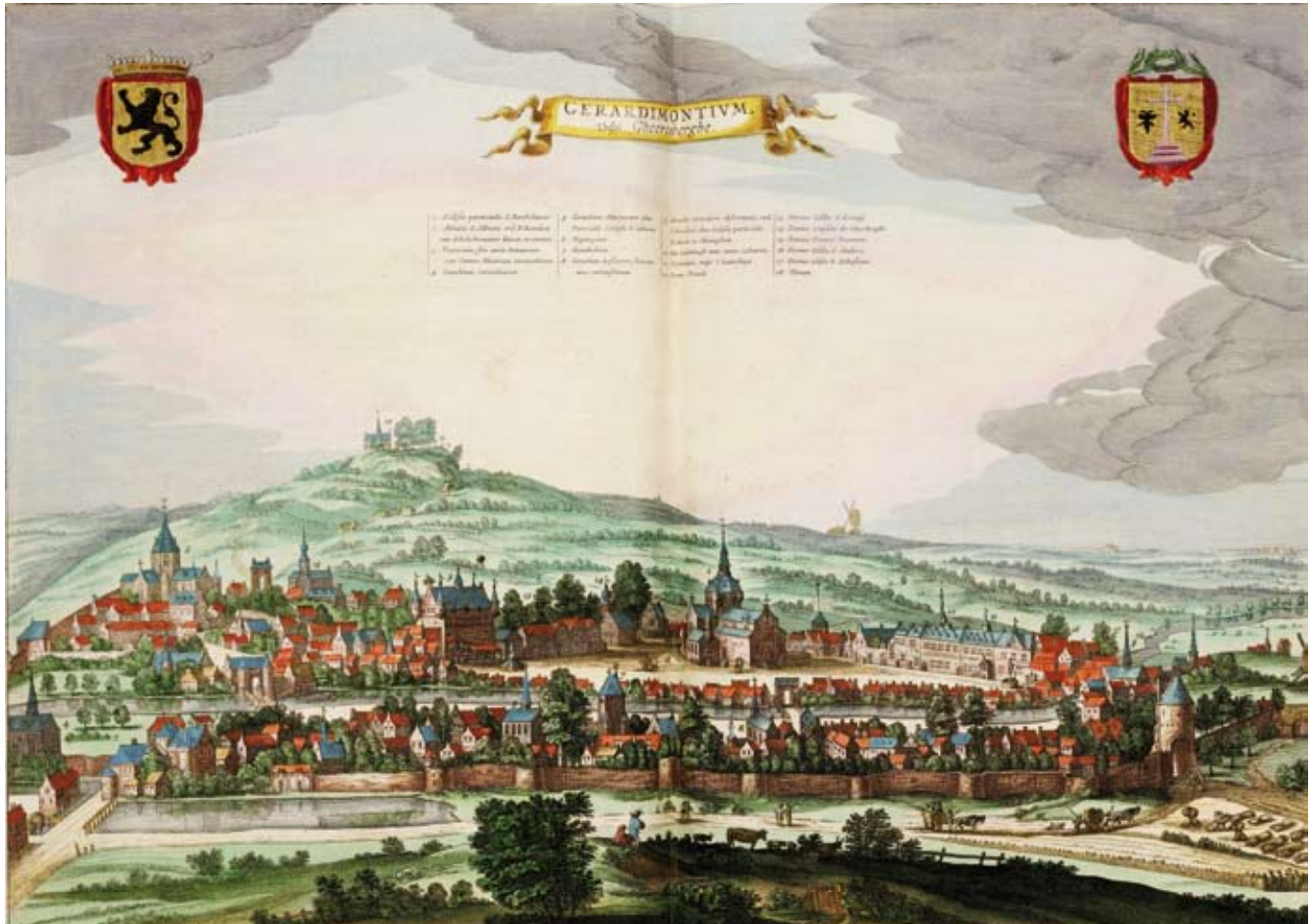
Geraardsbergen, ingekleurde kopergravure door C. de Passe, gepubliceerd door Joan Blaeu uit 1649. Links is de Sint-Adriaansabdij afgebeeld. Bovenaan zien we de Oudenberg en de windmolen van de abdij.

aangestoken. Krakelingenworp en Tonnekensbrand worden reeds in 1393 in de oudste stadsrekening vermeld.