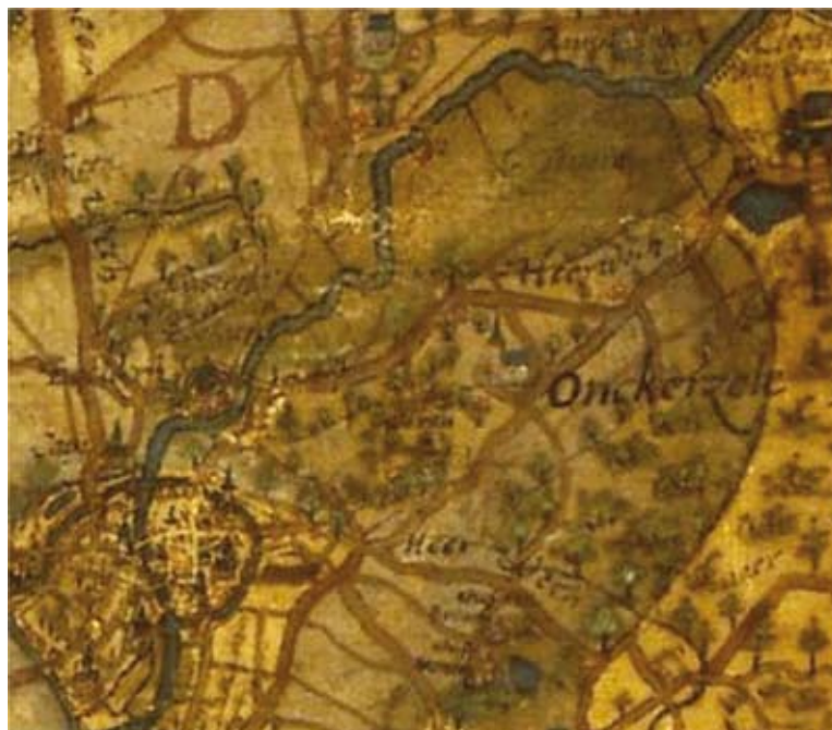
ONKERZELE - detail uit de Horenbaultkaart van het Land van Aalst.- 1595 In het midden staat de kerk van Onkerzele afgebeeld. Het Raspaillebos reikt nog tot bijna aan de kerk. Onderaan zijn het Hof ten Broeke en het Hof van Montoye (of ten Buikmeers) aangegeven.