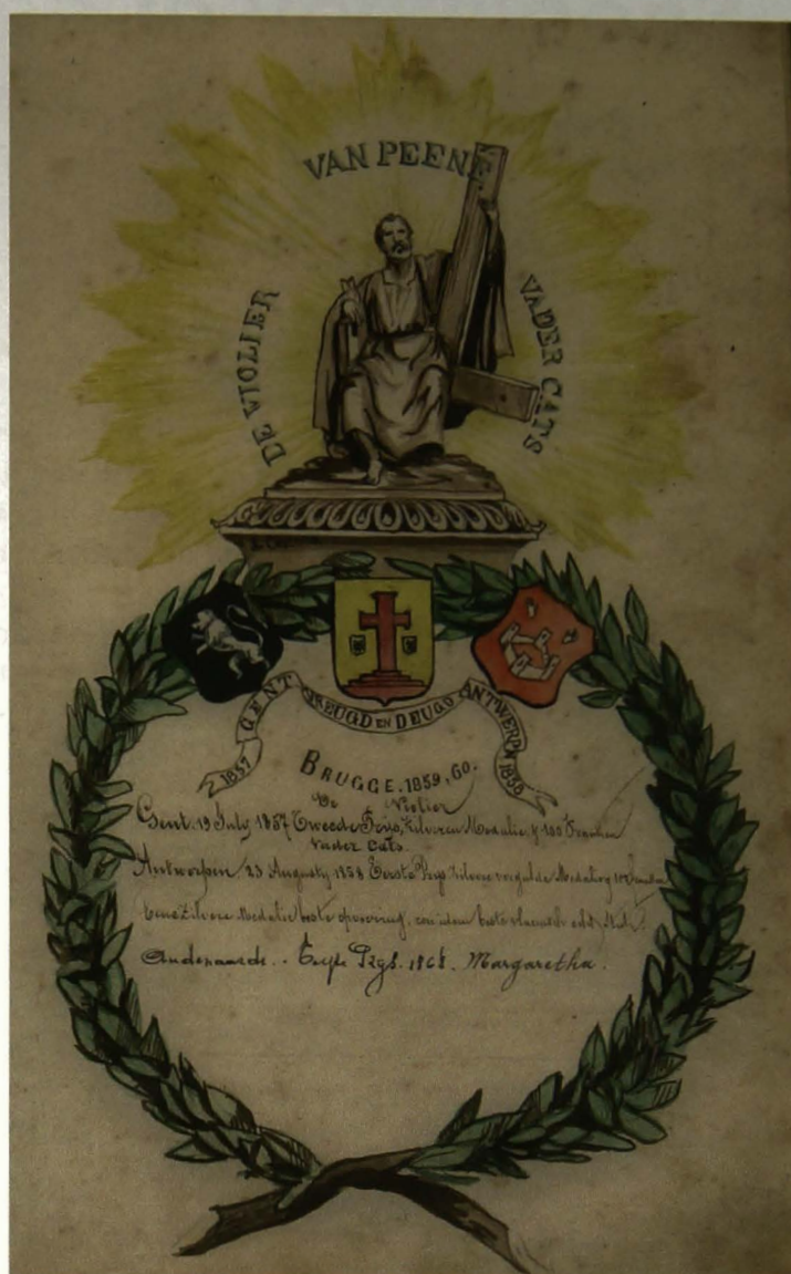
De eervolle vermeldingen van behaalde prijzen

Hiervoor grijpt Ceuterick terug naar de bloemenkrans die op barokschilderijen de vier jaargetijden en dus ook de vergankelijkheid van alle schoonheid (vanitas) symboliseert. Van links naar rechts zien we bloemen ontluiken o.a. een tulp, een pioen en een roos die met levendig rood en geel zijn ingekleurd. De rechterzijde is duidelijk veel minder kleurrijk en herinnert aan de herfst en het 'vallen' van de blaren. Ceuterick gebruikt fijne rode lijntjes om alleen de omtrek van o.a. klimopbladeren te tekenen. Met zacht groen heeft hij zeer handig het bladgroen geschilderd met donkere tonen in de schaduwpartijen. Bemerkt onderaan rechts een bloem die zeer dun is aangezet...en haast in het niets van de winter verdwijnt.