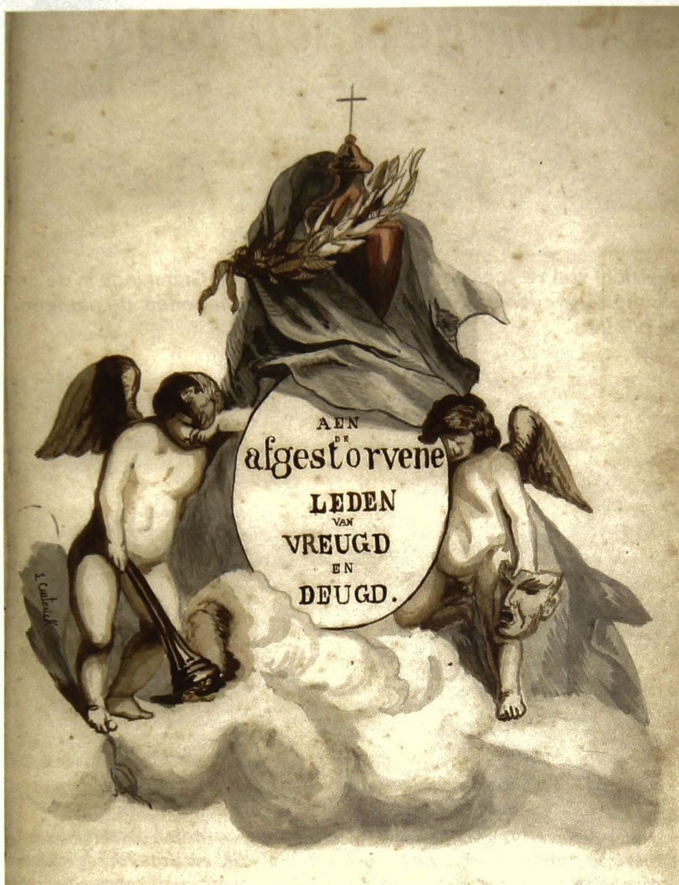
Voor de afgestorven leden

In een driehoekige compositie met zuivere grijstinten geschilderd, wordt een "hemels" beeld geschetst voor de afgestorven leden. Twee treurende gevleugelde engelen dragen de emblemen van de maatschappij: rechts het masker voor het toneel en links een trompet voor de muziek. De engeltjes zijn in gebrande sienna geschilderd en leunen tegen het medaillon waarop de tekst is geschreven. Bovenaan prijkt een soort grafurne met lauwerkrans en kruis, waarrond een grijs gewaad gedrapeerd is. Ceuterick heeft dit meesterlijk in beeld gebracht met een geslaagde dégradé. De plooien zijn vloeiend getekend en verraden zijn opleiding als architect. Het geheel 'vliegt' op een wolk hemelwaarts. De wolken zijn zoals bij alle landschapsschilders met hun grijze zijde naar onder geschilderd.