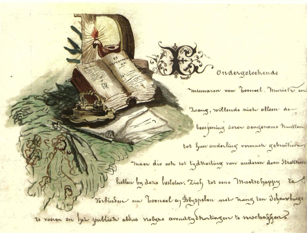
De derde pagina