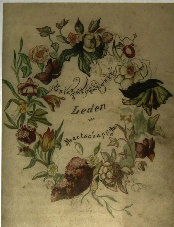
Briefwisselende leden der maatschappij

Hiervoor grijpt Ceuterick terug naar de bloemenkrans die op barokschilderijen de vier jaargetijden en dus ook de vergankelijkheid van alle schoonheid (vanitas) symboliseert. Van links naar rechts zien we bloemen ontluiken o.a. een tulp, een pioen en een roos die met levendig rood en geel zijn ingekleurd. De rechterzijde is duidelijk veel minder kleurrijk en herinnert aan de herfst en het 'vallen' van de blaren. Ceuterick gebruikt fijne rode lijntjes om alleen de omtrek van o.a. klimopbladeren te tekenen. Met zacht groen heeft hij zeer handig het bladgroen geschilderd met donkere tonen in de schaduwpartijen. Bemerkt onderaan rechts een bloem die zeer dun is aangezet...en haast in het niets van de winter verdwijnt.