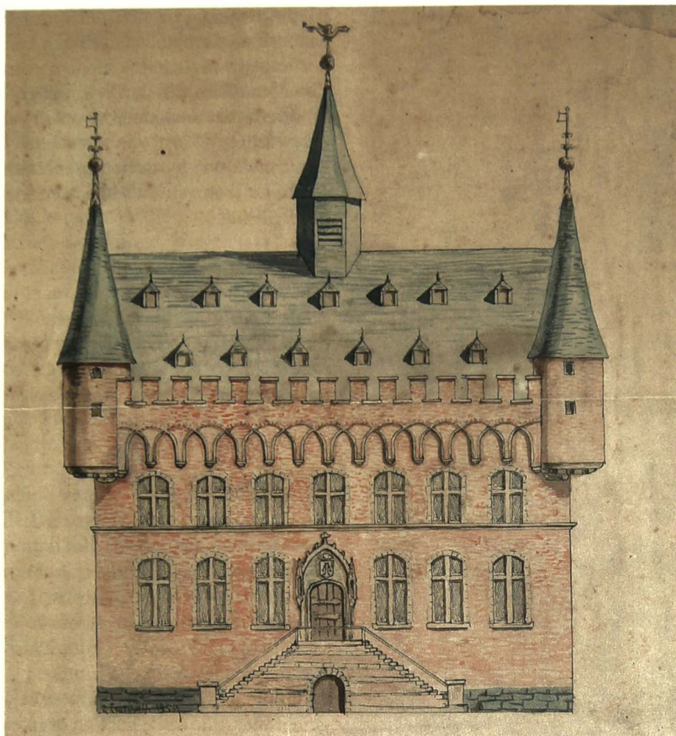
Ontwerptekening uit 1859 van het stadhuis in neogotische stijl door Louis Ceuterick. De centraal gelegen toegang is niet gevolgd tijdens de restauratie in 1891 onder leiding van architect Pieter Langeroock (Stadsarchief).

en zal zijn hele leven in het ouderlijk huis wonen.