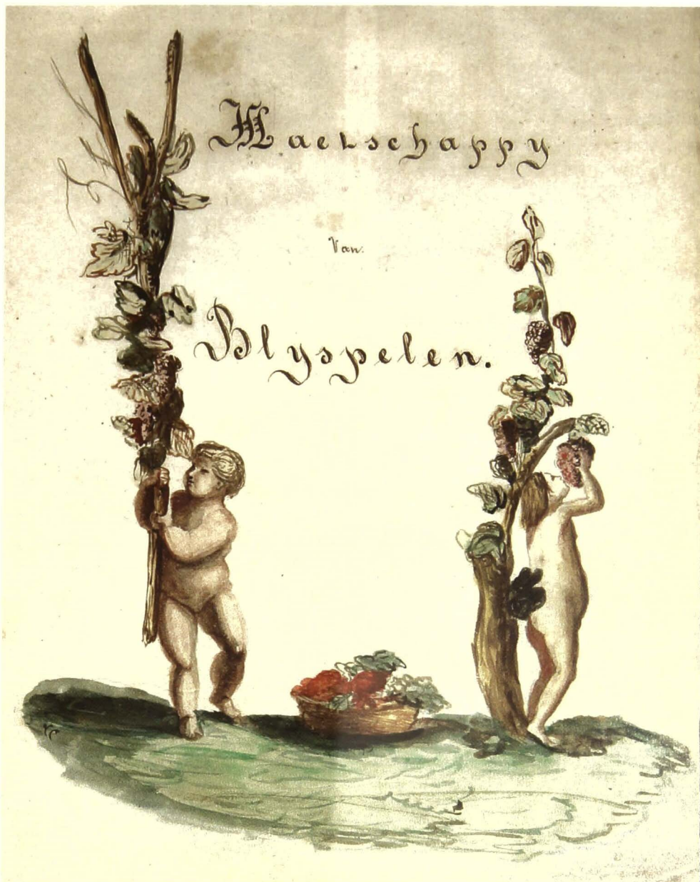
De tweede pagina

Ceuterick doet zoals de miniaturisten: hij neemt de eerste letters D en E om er zijn decoratie rond te tekenen. We zien op een groen veld, een rococo-inktspot en vellen papier die verwijzen naar de schrijfact. De brandende olielamp duidt op de verheffende kracht van de geest, het licht dat in de duisternis schijnt. Het gilde wil hier zijn steentje toe bijdragen.