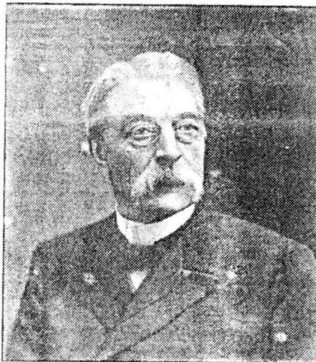
Libérale Senator van het Arrondissement Aalst. Aalst. Sénateur Libéral pour les Arrondissements d'Aalst et de Nivelles.