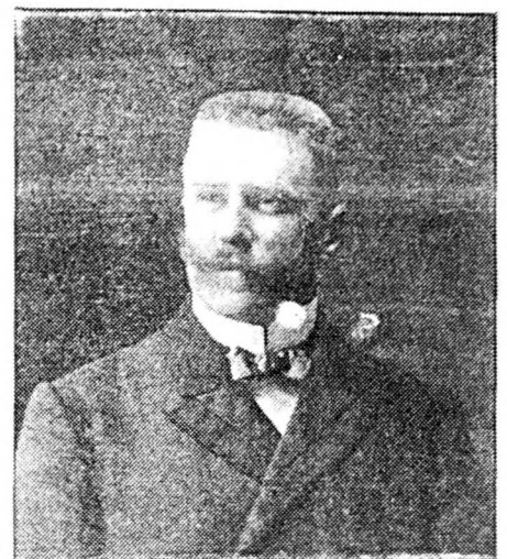
Bijgevoegd Libérale Volksvertegenwoordiger van het Arrondissement Aalst. Eerste lijst van de Liberalen, Aalst.

In datzelfde kader moet ook de oprichting gezien worden van de "Jeune Garde Liberale" (1884-85) die als kweekschool fungeerde voor de nieuwe radicale politieke formatie.