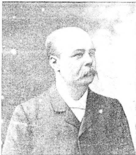
Libérale Volksvertegenwoordiger van het Arrondissement Aalst. Eerste lijst van de Liberalen, Aalst.